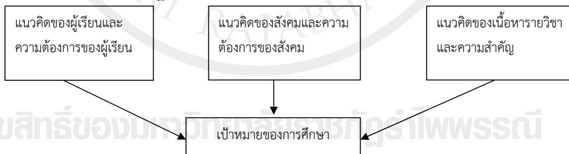
แผนภาพที่ 2.3 แสดงองค์ประกอบของหลักการและเหตุผลของรายวิชาหลักสูตรพหุวัฒนธรรม

จากแนวคิดของPosner & Rudnitsky (2005) ได้เสนอหลักการและเหตุผลของรายวิชา ประกอบด้วยความคิดของผู้เรียน สังคมและเนื้อหาเป็นตัวกำหนดเป้าหมายของรายวิชา สำหรับผู้สอยที่ต้องการออกแบบหลักสูตร โดยการมุ่งการเรียนการสอนเน้นความเข้าใจมากกว่าเน้นสังคม การเน้นผู้เรียนเป็นศูนย์กลางหรือการเน้นเนื้อหาในการออกแบบหลักสูตรพหุวัฒนธรรมนั้น ต้องมีองค์ประกอบมากกว่าสิ่งดังกล่าว แนวคิดค่านิยมพื้นฐานต้องปรากฏอยู่ในการศึกษาเชิงพหุวัฒนธรรมและการศึกษาของโลก ค่านิยมเหล่านี้สนองต่อการรับรู้ของผู้เรียน สังคม รายวิชา เนื้อหาและเป้าหมายที่กำหนด ดังปรากฏในภาพที่ 2.3 และภาพที่ 2.4 ต่อไปนี้