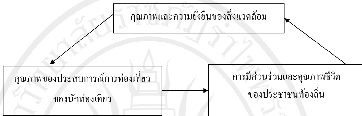
ภาพที่ 3 ความสัมพันธ์ของเป้าหมายหลัก 3 ประการของการท่องเที่ยวอย่างยั่งยืน