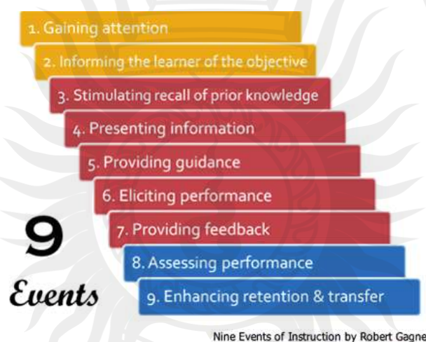
ภาพที่ 2 หลักการสอนตามแนวคิดของกาเย

กาเยได้นำเอาแนวความคิดมาใช้ในการเรียนการสอนโดยยึดหลักการนำเสนอเนื้อหา และจัดกิจกรรมการเรียนรู้จากการมีปฏิสัมพันธ์ หลักการสอน 9 ประการ รายละเอียดแต่ละขั้นตอน มีดังนี้