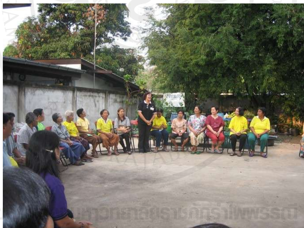
ภาพที่ 3 ประชาคมสมาชิกชมรมพัฒนาชุมชนริมน้ำจันทบูร