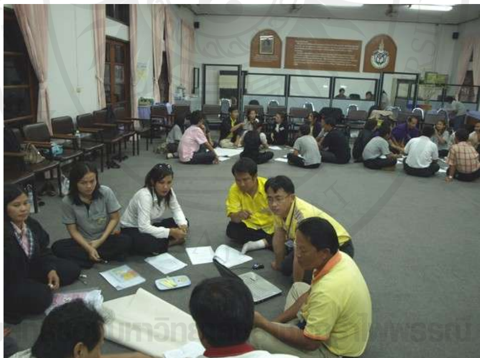
ภาพที่ 2 ร่วมเจรจาต่อรองระหว่างกลุ่มคณะกรรมการชุมชนริมน้ำจันทบูร กับเจ้าหน้าที่พาณิชย์จังหวัดจันทบุรี