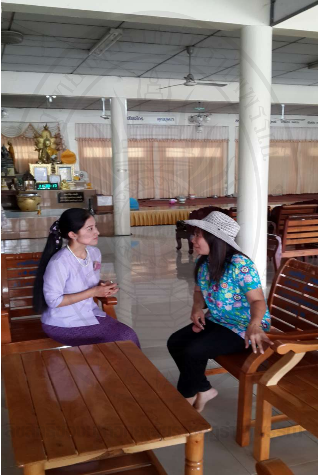
ภาพที่ 5 สัมภาษณ์คณะกรรมการชุมชนริมน้ำจันทบูร