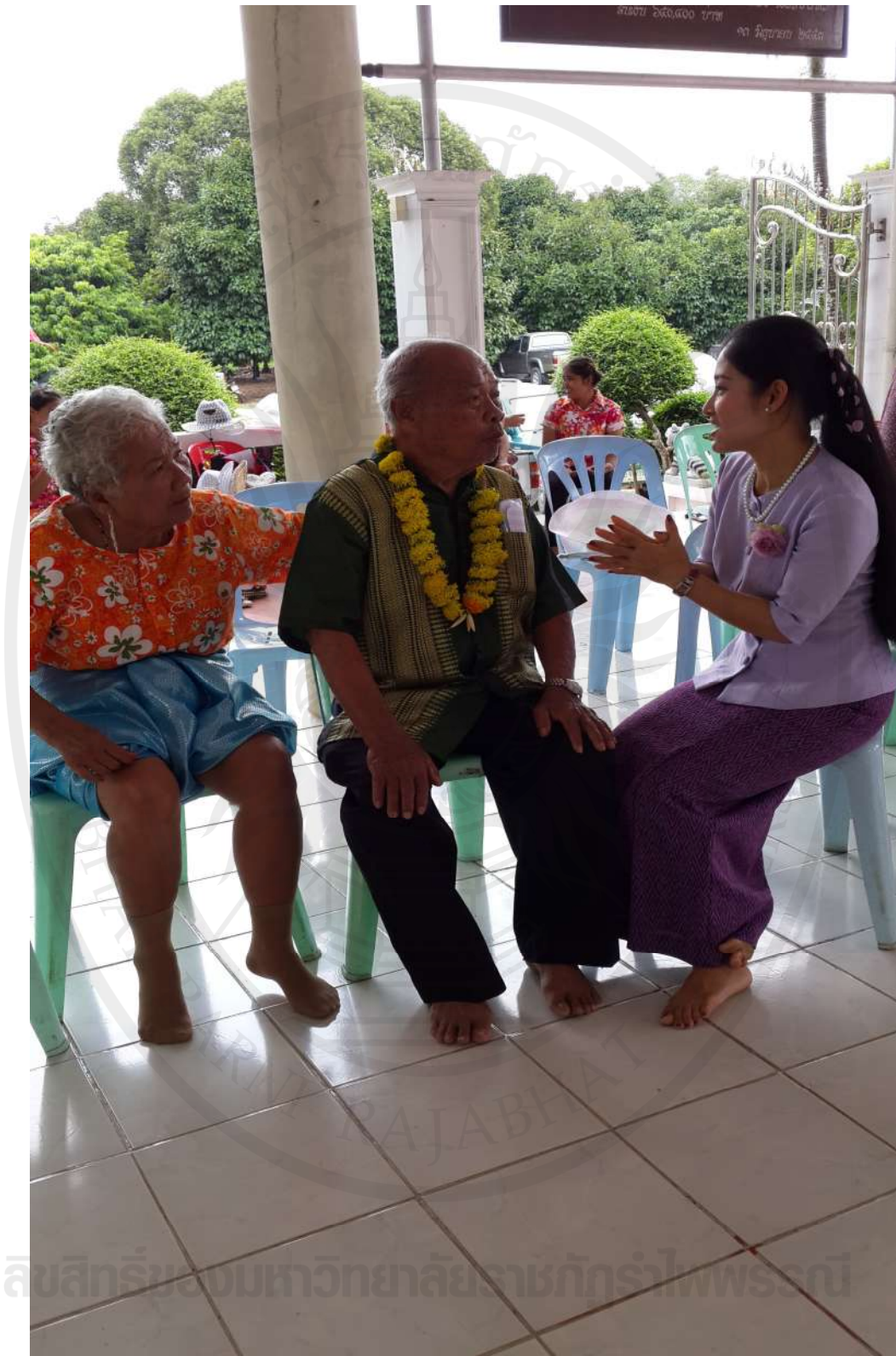
ภาพที่ 6 สัมภาษณ์ชาวชุมชนริมน้ำจันทบูร