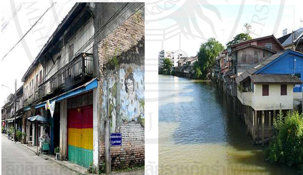
ภาพที่ 1 ชุมชนริมน้ำจันทบูร จังหวัดจันทบุรี