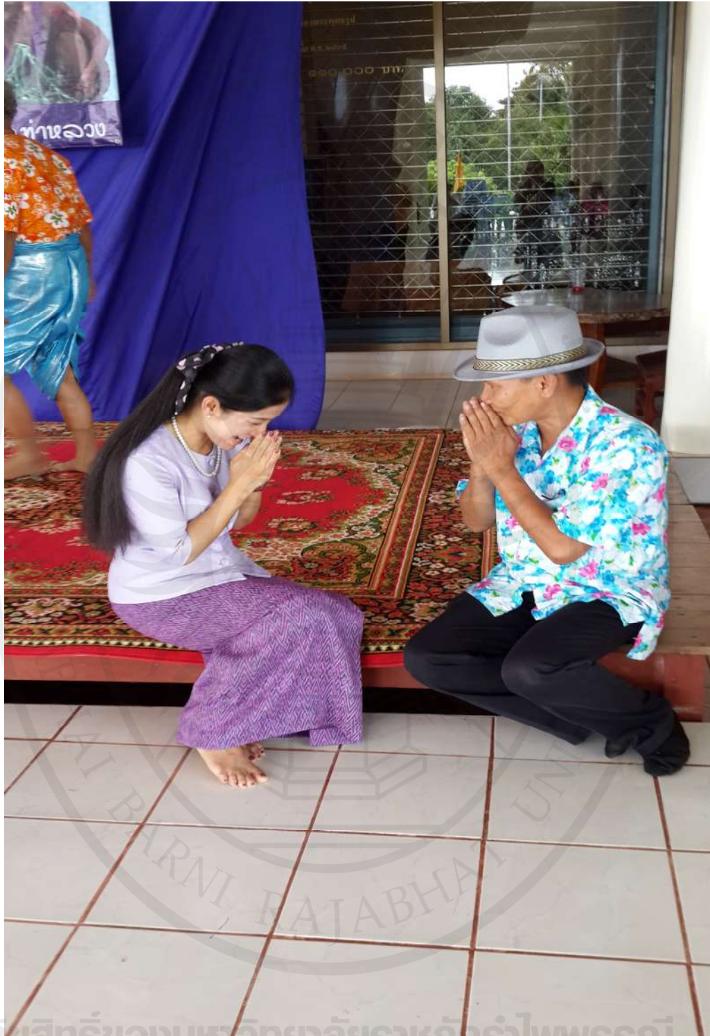
ภาพที่ 7 สัมภาษณ์สมาชิกชมรมพัฒนาชุมชนริมน้ำจันทบูร