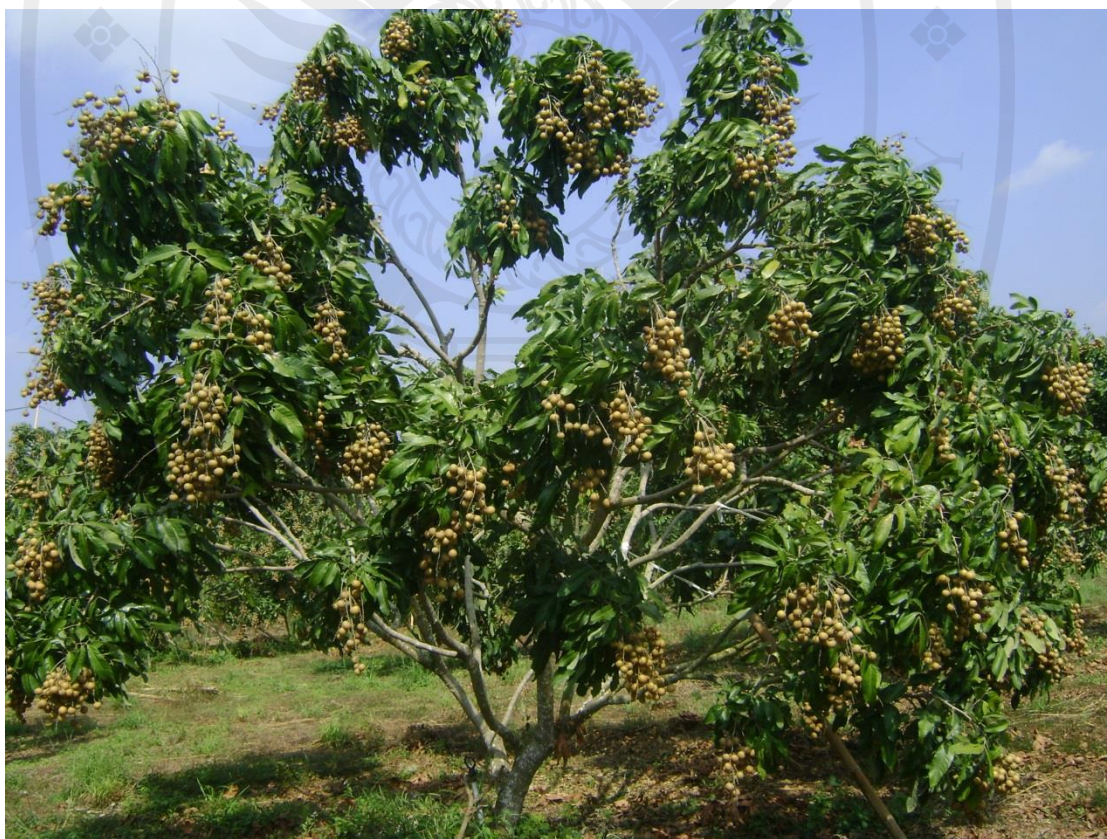
ภาพที่ 2 ต้นลำไย

ลำต้น มีขนาดลำต้นสูงปานกลางจนถึงขนาดใหญ่ ต้นที่ขยายพันธุ์ด้วยเมล็ดจะมีลำต้นตรง เมื่อเจริญเติบโตเต็มที่มีความสูงประมาณ 12-15 เมตร และถ้าหากเป็นต้นที่ขยายพันธุ์ด้วยการตอนกิ่ง จะแตกกิ่งก้านสาขาใกล้ๆกับพื้น และถ้าได้รับการตัดแต่งกิ่งในขณะที่ต้นยังเล็กมักแตกลำต้นเทียมหลายต้น ลำต้นที่เกิดขึ้นไม่ค่อยเหยียดตรงมักเอนหรือโค้งงอเปลือกลำต้น ขรุขระมีสีเทาหรือสีเทาปนน้ำตาลแดงเป็นสะเก็ด