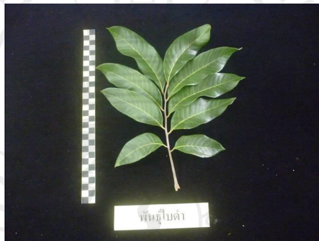
ภาพที่ 3 ใบลำไย

ใบ เป็นใบรวมที่ประกอบด้วยใบย่อยอยู่บนก้านใบรวมกัน (pinnately compound leaves) มีปลายใบเป็นคู่ มีใบย่อย 3-5 คู่ ความยาวใบ 20-30 เซนติเมตร ใบย่อยเรียงตัวสลับหรือเกือบตรงข้าม ความกว้างของใบย่อย 3-6 เซนติเมตร ยาว 7-15 เซนติเมตร รูปร่างใบเป็นรูปรีหรือรูปหอก ส่วนปลายใบและฐานใบค่อนข้างป้าน ใบด้านบนมีสีเขียวเข้มกว่าด้านล่างเล็กน้อย ขอบใบเรียบไม่มีหยัก ใบเป็นคลื่นเล็กน้อย และเห็นเส้นแขนง (vein) แตกออกมาจากเส้นกลางใบชัดเจนและมีจำนวนมาก