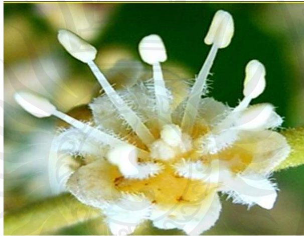
ภาพที่ 5 ดอกตัวผู้

ก. ดอกตัวผู้ มีเกสรตัวผู้ 6-8 อันเรียงเป็นชั้นเดียวกันบนจานรองดอก(disc) ซึ่งมีสีน้ำตาลอ่อนและมีลักษณะอูมน้ำ ก้านชูเกสรตัวผู้มีขน เกสรตัวผู้มีความยาวสม่ำเสมอคือยาวประมาณ 3-5 มิลลิเมตร อับเรณูมี 2 หยัก และเมื่อแตกจะแตกตามยาว (longitudinal dehiscence)