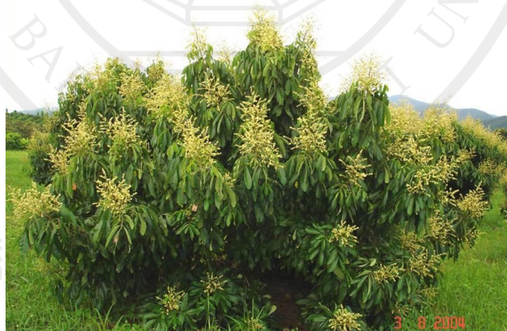
ภาพที่ 4 ช่อดอกลำไย

ช่อดอก ส่วนมากเกิดจากตาที่ปลายยอด (terminal bud) บางครั้งอาจเกิดจากตาข้างของกิ่ง ช่อดอกยาวประมาณ 15-60 เซนติเมตร ช่อดอกขนาดกลางจะมีดอกย่อยประมาณ 3,000 ดอก