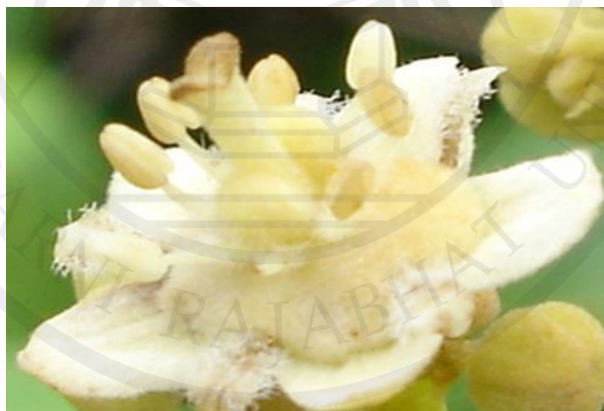
ภาพที่ 7 ดอกสมบูรณ์เพศ

ค. ดอกสมบูรณ์เพศ มีทั้งเกสรตัวผู้และเกสรตัวเมียอยู่ในดอกเดียวกัน รังไข่พองเป็นกระเปาะค่อนข้างกลม ขนาดเล็กกว่ารังไข่ของดอกเพศเมีย ยอดเกสรตัวเมียจะสั้นกว่าและตรงปลายจะแยกเพียงเล็กน้อยเมื่อดอกบาน ก้านชูอับละอองของดอกสมบูรณ์เพศจะมีความยาวสม่ำเสมอ คือ มีความยาวอยู่ระหว่าง 1.5 -3.0 เซนติเมตร ดอกสมบูรณ์เพศสามารถติดผลได้เช่นเดียวกับดอกตัวเมีย