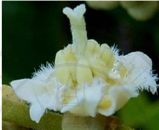
ภาพที่ 6 ดอกตัวเมีย