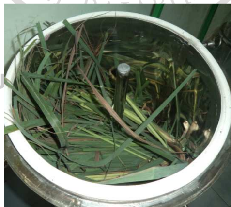
ภาพภาคผนวกที่ ก.12 แสดงการบรรจุพืชสมุนไพรในหม้อต้มกลิ่น