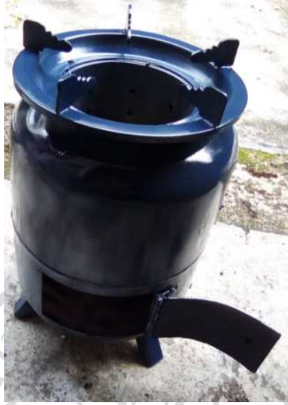
ภาพภาคผนวกที่ ก.7 แสดงเตาชีวมวล