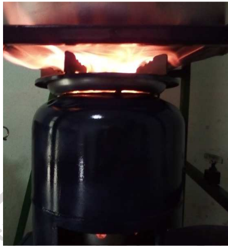
ภาพภาคผนวกที่ ก.13 แสดงการให้ความร้อนหม้อต้มกลั่น