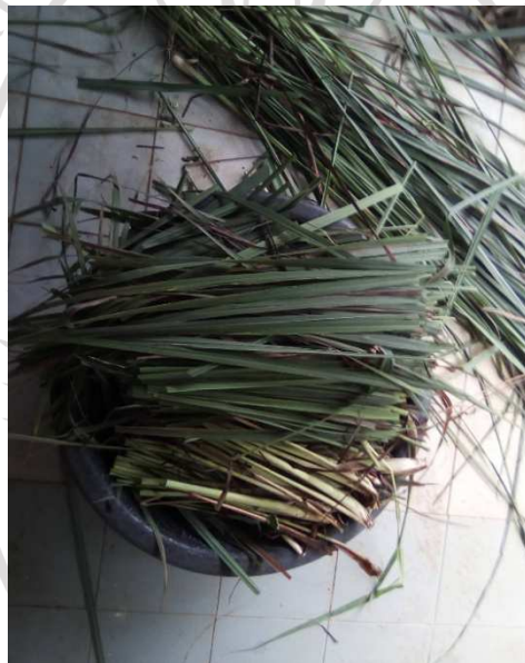
ภาพภาคผนวกที่ ก.11 การเตรียมพืชสมุนไพรสำหรับทดลอง