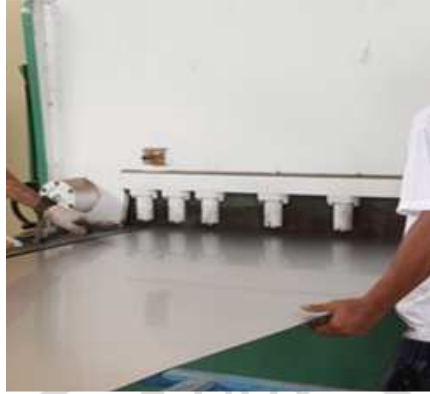
ภาพภาคผนวกที่ ก.1 การตัดแผ่นสแตนเลสเพื่อขึ้นรูป