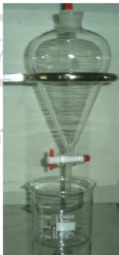
ภาพภาคผนวกที่ ก.6 แสดงภาชนะรองรับน้ำมันหอมระเหย