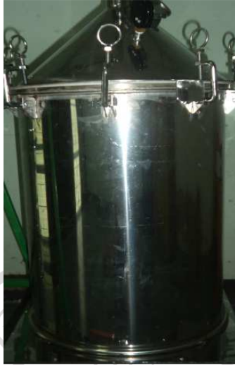
ภาพภาคผนวกที่ ก.4 แสดงหม้อต้มกลั่นพีซีสมุนไพรม