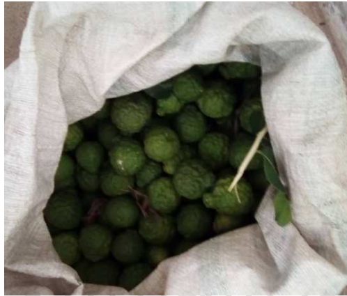
ภาพภาคผนวกที่ ก.10 ลูกมะกรูดที่ใช้ทดลอง