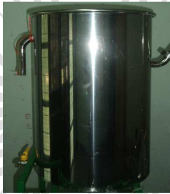
ภาพภาคผนวกที่ ก.5 แสดงถังความดัน