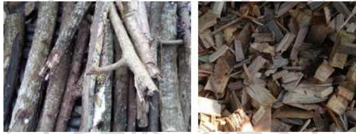
ภาพภาคผนวกที่ ก.8 เชื้อเพลิงชีวมวลที่ใช้