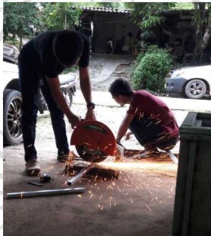
ภาพภาคผนวกที่ ก.2 การทำชุดโครงสร้าง