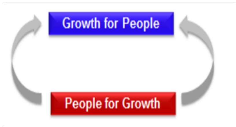
ภาพที่ 2.3 Growth for People/ People for Growth ที่มา (กองบริหารงานวิจัยและประกันคุณภาพการศึกษา, 2560)