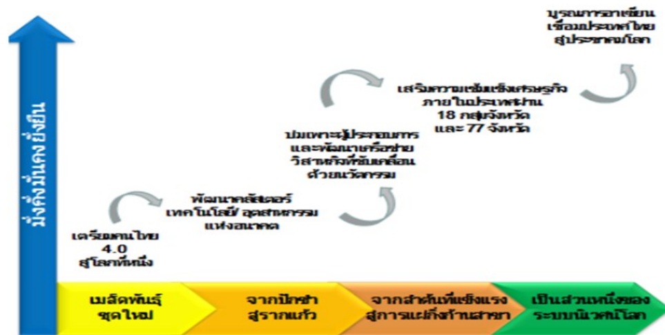
ภาพที่ 2.2 ท้าวาระในการขับเคลื่อนโมเดล Thailand 4.0 ที่มา (กองบริหารงานวิจัยและประกันคุณภาพการศึกษา, 2560)

สำหรับการเตรียมคนไทย 4.0 เพื่อก้าวสู่โลกที่หนึ่ง เปรียบเสมือนการเตรียมเมล็ดพันธุ์ใหม่ ด้วยการบ่มเพาะคนไทยให้เป็นมนุษย์ที่สมบูรณ์ในศตวรรษที่ 21 ควบคู่ไปกับการพัฒนาคนไทย 4.0 สู่อุโมงค์หนึ่ง คนไทยเป็นมนุษย์ที่สมบูรณ์ในศตวรรษที่ 21 คือ คนไทยที่มีปัญญาที่เฉียบแหลม (Head) มีทักษะที่เห็นผล (Hand) มีสุขภาพที่แข็งแรง (Health) และมีจิตใจที่งดงาม (Heart) การเป็นมนุษย์ที่สมบูรณ์เป็นเงื่อนไขที่จำเป็นในการเตรียมคนไทย 4.0 สู่อุโมงค์หนึ่ง ซึ่งจะครอบคลุมการปรับเปลี่ยนใน 4 มิติ ดังต่อไปนี้