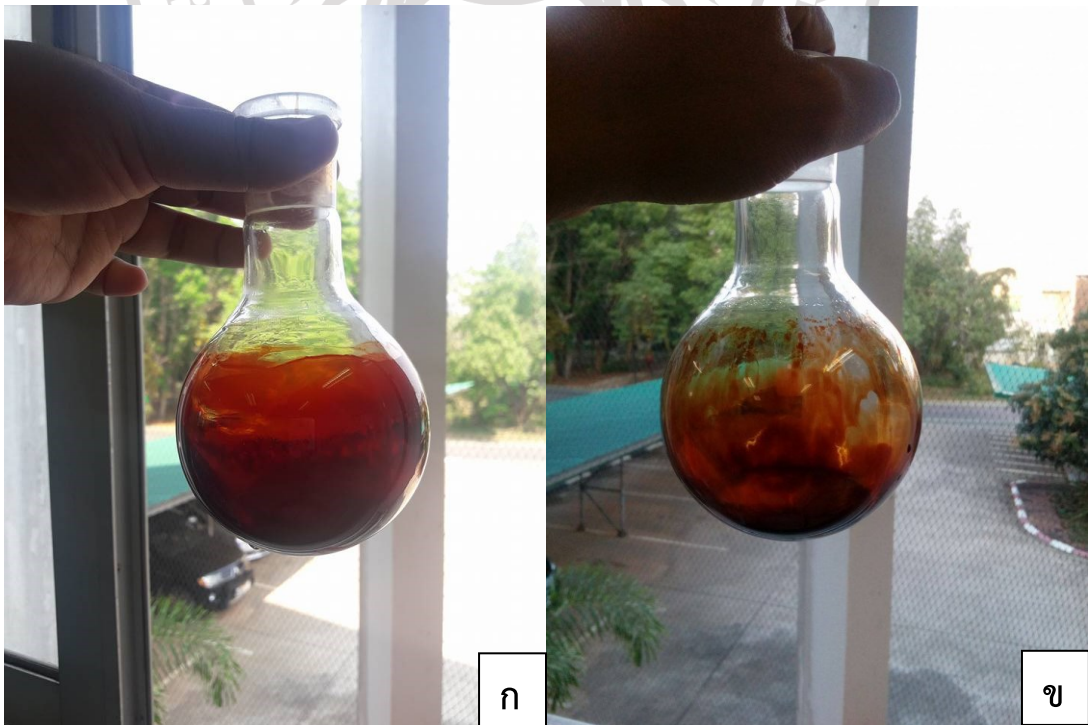
ภาพภาคผนวกที่ 2 สารสกัดหยาบจากอบเชย (ก) สารสกัดหยาบจากโป๊ยกิ่ง (ข)