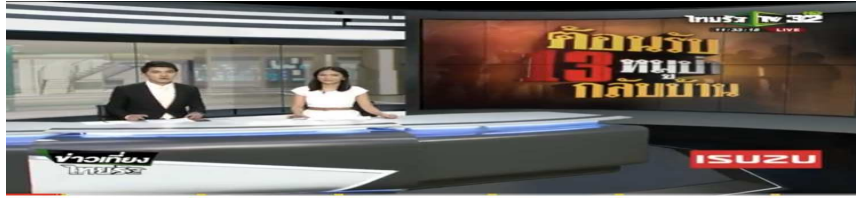
Live : ข่าวเที่ยงไทยรัฐ ต้อนรับ 13 หมูป่ากลับบ้าน #ถ้าหลวงล่าสุด #ทีมหมูป่า #ข่าว13ชีวิต การดู 147,510 ครั้ง