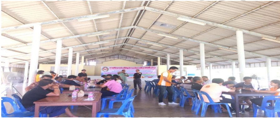
ภาพที่ 10 ชาวประมงแลกเปลี่ยนและระดมความคิดเห็นเกี่ยวกับปัญหาต่างๆในการทำประมง