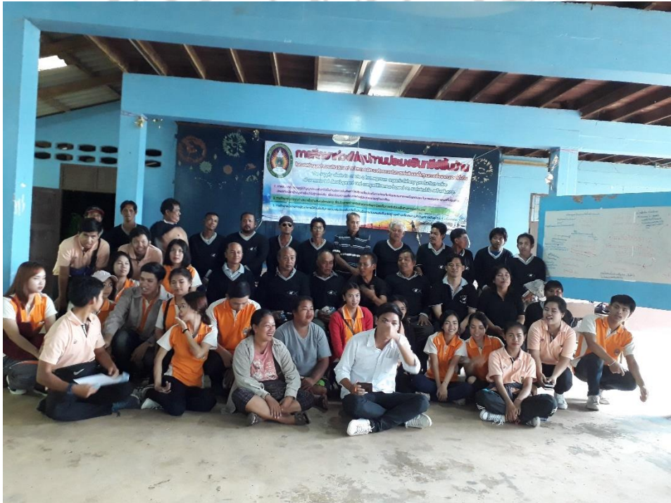
ภาพที่ 15 การประเมินสถานะการทำประมงบ้านเปร็ดใน จังหวัดตราด