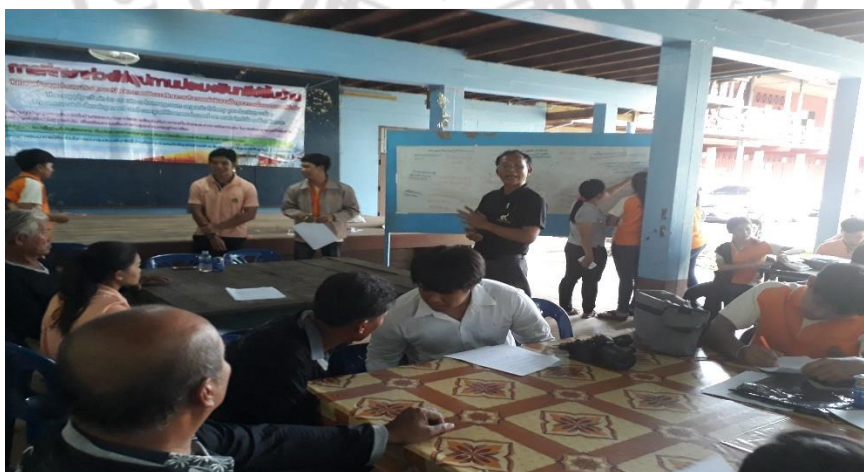
ภาพที่ 14 บริเวณท่าเทียบเรือประมงพื้นบ้านบ้านน้ำเชี่ยว จังหวัดตราด