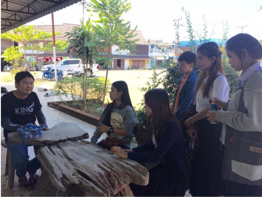
ภาพที่ 1 ติดต่อผู้ใหญ่อาร์ม เรื่องการลงพื้นที่