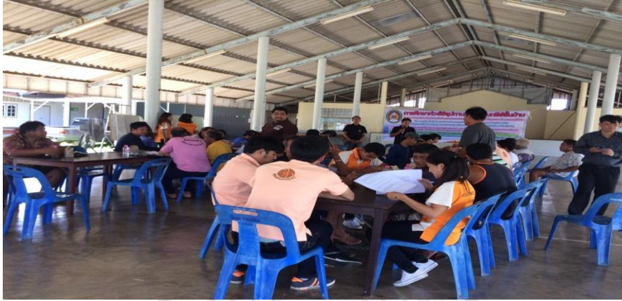
ภาพที่ 9 สัมภาษณ์ชาวประมงพื้นบ้านชุมชนบ้านท่าแลบ