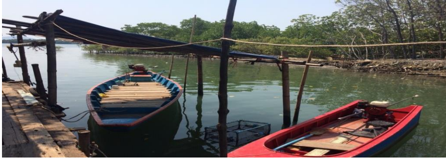
ภาพที่ 3 เรือที่ลุงอุดมใช้ทำการประมง