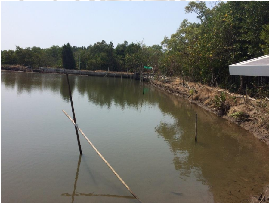
ภาพที่ 8 บ่อเลี้ยงปูของลุงอุดม