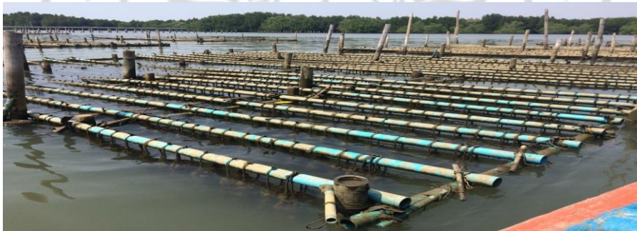
ภาพที่ 5 สถานที่เลี้ยงหอยนางรม เพาะเชื่อนางรมของลุงอุดม