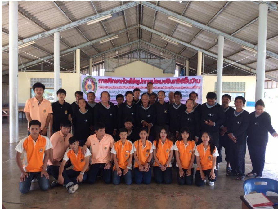
ภาพที่ 11 จบการแลกเปลี่ยนและระดมความคิดเห็นเกี่ยวกับปัญหาที่เกิดขึ้น มีการแจกเสื้อให้กับผู้ที่เข้าร่วมในครั้งนี้