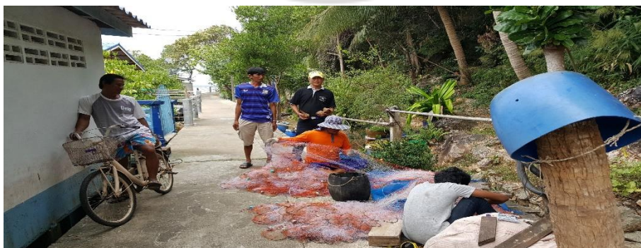
ภาพที่ 16 การประเมินสถานะการทำประมงบ้านเกาะจิก จังหวัดจันทบุรี