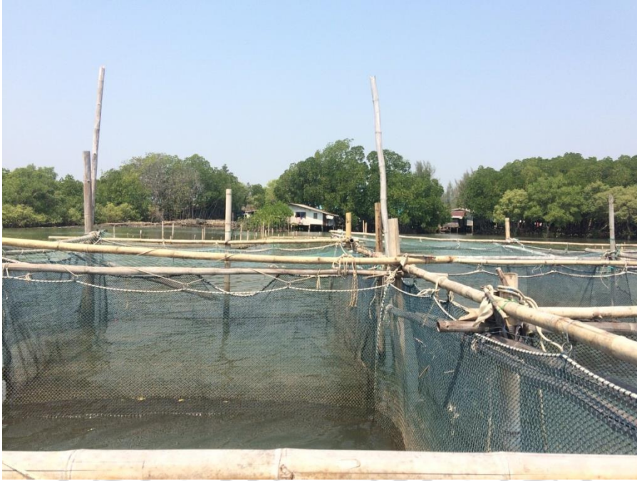
ภาพที่ 7 กระจังปลาของลุงอุดม