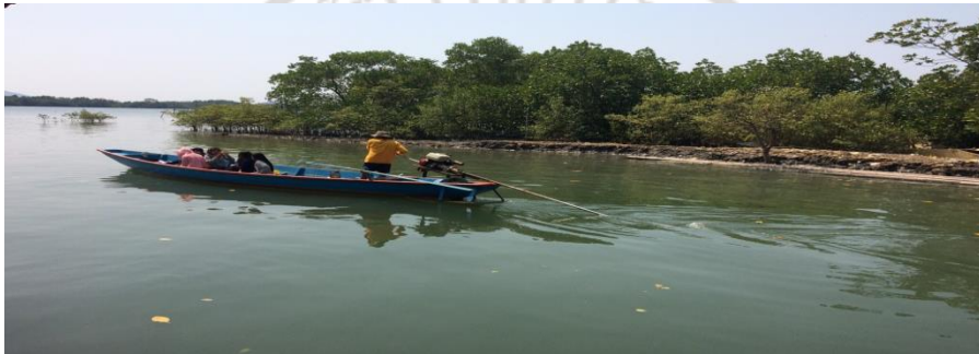
ภาพที่ 4 นั่งเรือดูสถานที่เลี้ยงสัตว์น้ำของลุงอุดม