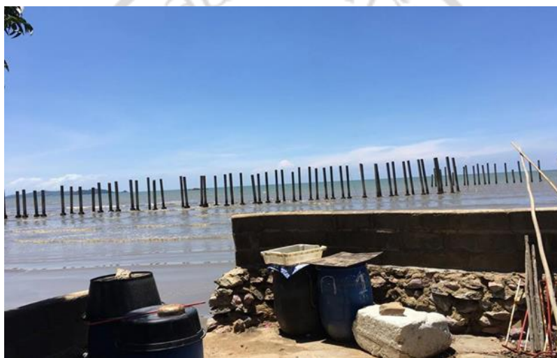
ภาพที่ 13 บริเวณท่าเทียบเรือประมงพื้นบ้านปากน้ำแฉมหนู จังหวัดจันทบุรี