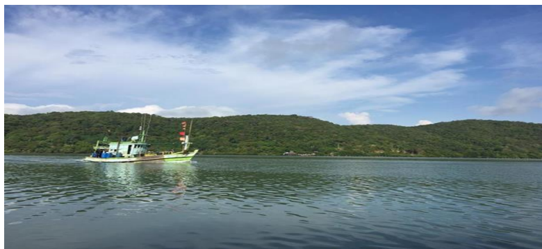
ภาพที่ 12 บริเวณจับสัตว์น้ำประมงพื้นบ้านปากน้ำแฉมหนู จังหวัดจันทบุรี