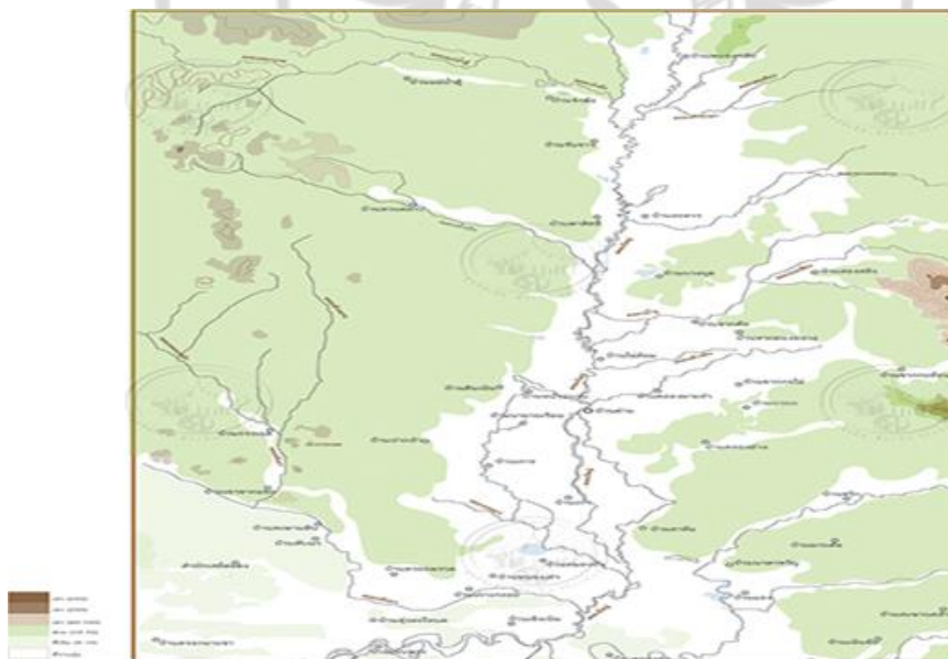
ภาพที่ 4.4 เส้นทางการเดินทางของสมเด็จพระเจ้าตากสินที่คาดว่าใกล้เคียงความจริง

บริเวณเส้นทางเดินทางที่กล่าวถึงในพระราชพงศาวดารนั้น เป็นเส้นทางห่างไกล และใช้เวลาในการเดินทางมาก และยังเป็นบริเวณที่ไม่มีเมืองสำคัญหรือชุมชนสำคัญใดๆตั้งอยู่ในรายทาง อีกทั้งบริเวณเมืองบางปลาสร้อยซึ่งอยู่บริเวณ “ท่าข้าม” ซึ่งเป็นจุดสำคัญทางยุทธศาสตร์ที่กองทัพพม่าไม่น่าจะพลาดโดยไม่มีกองกำลังควบคุมอยู่ซึ่งเมืองบางปลาสร้อยหากตีความตามเนื้อหาในพระราชพงศาวดารแล้ว เจ้าเมืองหรือผู้รั้งเมืองบางปลาสร้อย เช่น นายทองอยู่ นกเล็ก ก็เข้ากับฝ่ายกองกำลังพม่าไปแล้ว บริเวณนี้จึงเป็นจุดสำคัญที่กองกำลังของพระยาตากที่เพิ่งรบกับพม่าครั้งใหญ่ควรหลีกเลี่ยง นอกจากนี้บริเวณต่างๆ ตามรายทางเหล่านี้น่าจะเป็นการบันทึกของผู้ที่ไม่รู้จักหรือเข้าใจสภาพภูมิประเทศในท้องถิ่น เพราะพื้นที่ดังกล่าวห่างไกล ผู้คนเบาบางเพราะอยู่ใกล้ชายฝั่งทะเลที่ไม่อยู่ในเส้นทางเดินทางบกที่มีลำน้ำเชื่อมต่อภายในแผ่นดิน แม้แต่การเดินทางจากชลบุรีมายังเมืองระยองเมื่อไม่นานมานี้ก็ไม่เดินทางวกเข้าไปเลียบชายฝั่งบริเวณพัทยา นาจอมเทียน สัฒหีบมายังบ้านฉางแต่อย่างใด จากแผนที่เส้นทางการเดินทางของสมเด็จพระเจ้าตากสินที่คาดว่าใกล้เคียงความจริง ดังภาพที่ 4.4