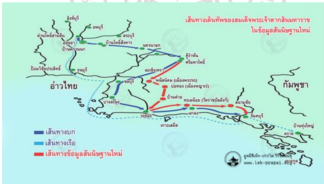
ภาพที่ 4.1 เส้นทางเดินทัพพระเจ้าตากสินมหาราช ของมุณนิสิทธ์-ประไพ วิริยะพันธุ์

องค์การปกครองส่วนท้องถิ่นร่วมกันสร้างป้ายหรือเส้นทางบอกเส้นทางการเดินทางเดินทัพของพระยาตาก โดยองค์การบริหารส่วนจังหวัดพระนครศรีอยุธยา ซึ่งเป็นการสนับสนุนเพื่อการศึกษาและการท่องเที่ยวเป็นสำคัญโดยอธิบายรายละเอียดจากพระราชพงศาวดารซึ่งเขียนแต่งเติมขึ้นในภายหลัง และนำเสนอว่าเป็น “เส้นทางศึกษาประวัติศาสตร์และวิถีชีวิต ชาวชนบทกรุงเก่า” และนำเสนอขายที่ไม่มีการสร้างพื้นที่เพื่อการศึกษาเช่นนี้นอกเหนือไปจากเขตการปกครองภายในจังหวัดพระนครศรีอยุธยา ช่วงเวลาแห่งการสู้รบเพื่อหนีจากทัพพม่าที่อยู่ประชิดเมือง และสู้รบตามรายทางใช้เวลาราว 2 - 3 วันจึงเดินทางเข้าเขตเมืองนครนายก ดังภาพที่ 4.1