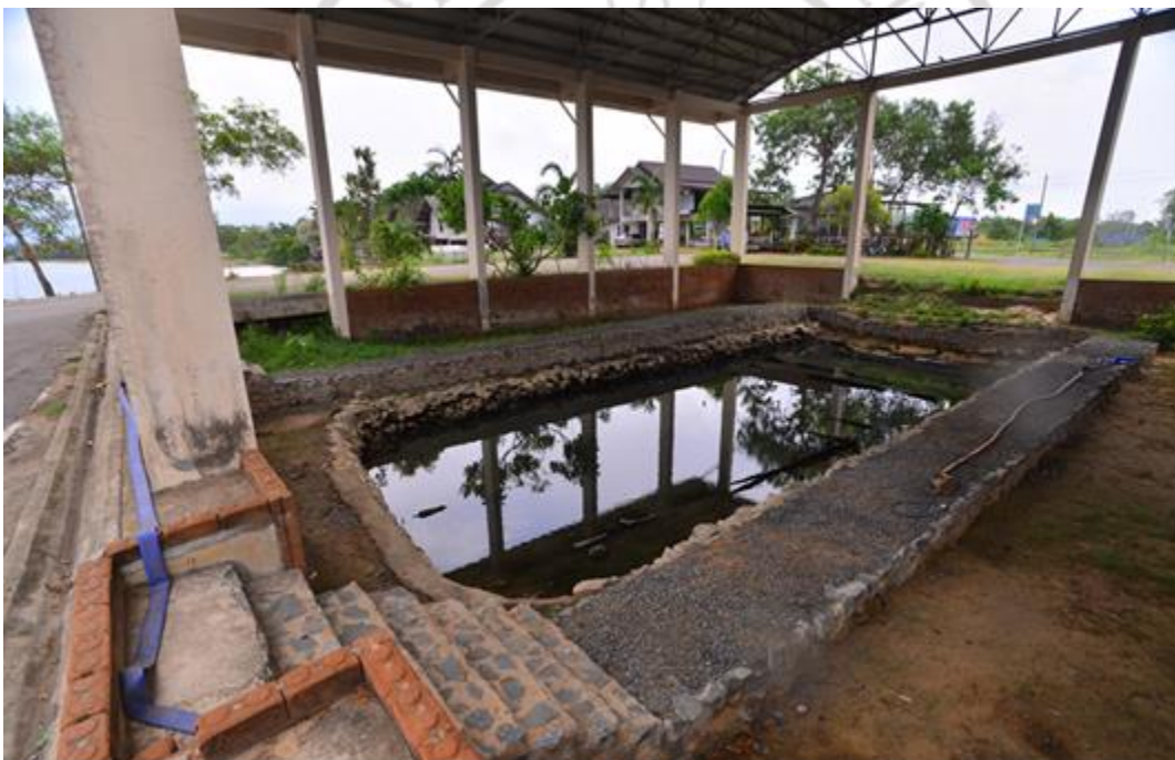
ภาพที่ 4.10 อยู่ต่อเรือพระเจ้าตากสินมหาราช เสม็ดงาม

จากหนังสือของ อาจารย์ งาม อาง บุญการี ได้เขียนเรื่อง 111 วันกับการกอบกู้เอกราชที่จันทบุรี ได้เขียนเรื่องราวของสมเด็จพระเจ้าตากสินมหาราช ว่ามีบางตอนได้กล่าว เรื่องการเสด็จในจังหวัดจันทบุรีตั้งหลักฐานที่ปรากฏเช่น อยู่ต่อเรือสมเด็จพระเจ้าตากสินมหาราช ดังภาพที่ 4.10