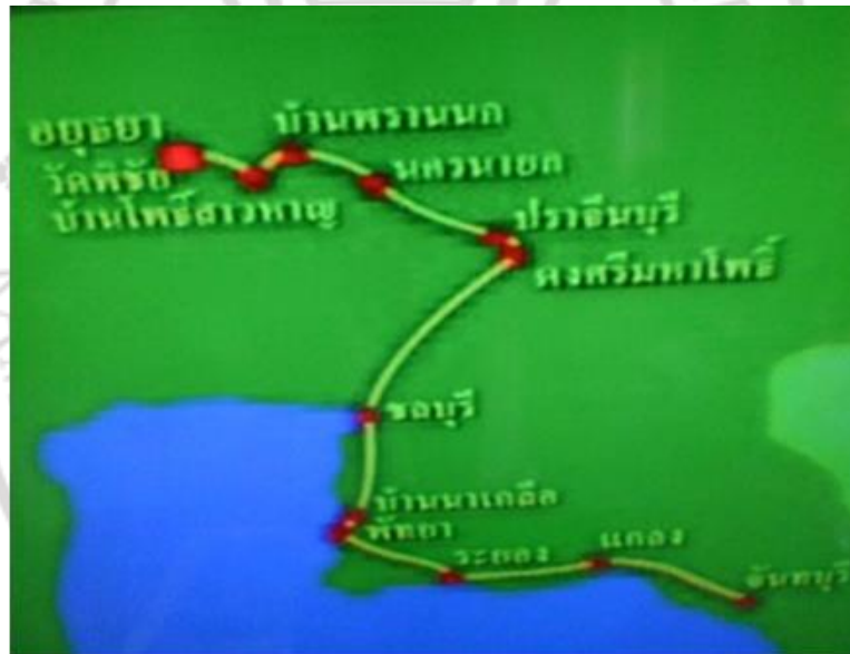
ภาพที่ 4.8 เส้นทางเสด็จทัพจากอยุธยาสู่จันทบุรี

ของชื่อบ้านนามเมืองสืบทอดกันมาเช่นนี้ ถือว่ามีความผูกพันที่สร้างขึ้นโดยธรรมชาติจากตำนานการเดินทัพ และพักทัพในบริเวณบ้านค่ายของทัพพระเจ้าตากที่เดินทางจากทางบ้านเมืองภายในมากทีเดียว และเป็นบันทึกความทรงจำที่อยู่นอกเหนือเส้นทางในพระราชพงศาวดารที่ใช้วิเคราะห์กันอยู่ในทุกวันนี้อย่างเด่นชัด ต่ำจากบริเวณวัดบ้านค่ายลงมาราว ๔ กิโลเมตร มี “วัดบ้านเก่า” ที่อยู่ริมลำน้ำคลองใหญ่หรือแม่น้ำระยอง บริเวณนี้มีพื้นที่ราบริมลำน้ำค่อนข้างน้อยและดูเป็นชุมชนใหญ่ในภายหลังจากวัดบ้านเก่าก็มีวัดตาชัน ซึ่งอยู่ใกล้กันแต่อยู่ในเขตอำเภอเมืองระยองแล้ว จากบริเวณนี้ในทิศทางต่ำลงไปริมลำคลองใหญ่และมีหนองน้ำใหญ่ตั้งอยู่มี “วัดนาตาขวัญ” และบ้านนาตาขวัญทางทิศตะวันออกใกล้เชิงเขามี “วัดแลงและบ้านแลง” ซึ่งต่อเนื่องไปจนถึง “วัดตะพงใน” ซึ่งมีชุมชนบ้านตะพงในทางตะวันออกของทุ่งราบลุ่มน้ำคลองใหญ่ ซึ่งมี “วัดทับมา” อยู่ทางตะวันตกสุดของทุ่งราบแห่งนี้ เส้นทางเสด็จจากอยุธยาสู่จันทบุรี ดังภาพที่ 4.8