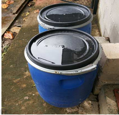
ภาพภาคผนวกที่ ก.7 ถังหมักสำรองถังวัดอุทก