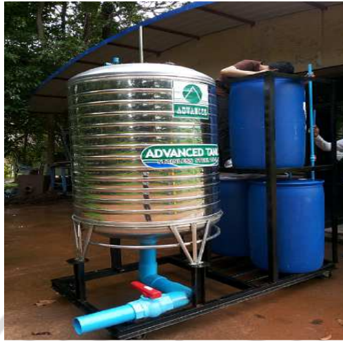
ภาพภาคผนวกที่ ก.10 ประกอบระบบการเดินท่อแก๊สชีวภาพ 2