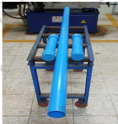
ภาพภาคผนวกที่ ก.6 ท่อ PVC สำหรับระบบแก๊สชีวภาพ