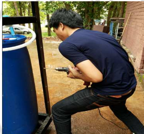
ภาพภาคผนวกที่ ก.8 ประกอบชุดยึดถังแก๊ส