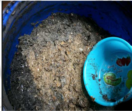
ภาพที่ 3.11 วัสดุดิบที่ใช้ผลิตแก๊สชีวภาพ