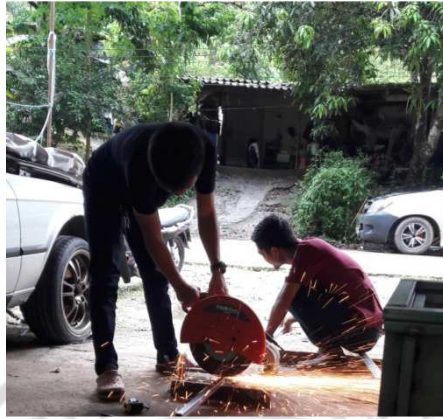
ภาพภาคผนวกที่ ก.1 การตัดวัสดุสำหรับโครงสร้าง