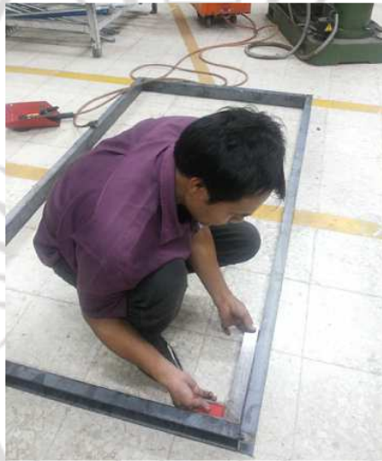
ภาพภาคผนวกที่ ก.2 การประกอบโครงสร้างระบบแก๊สชีวภาพ