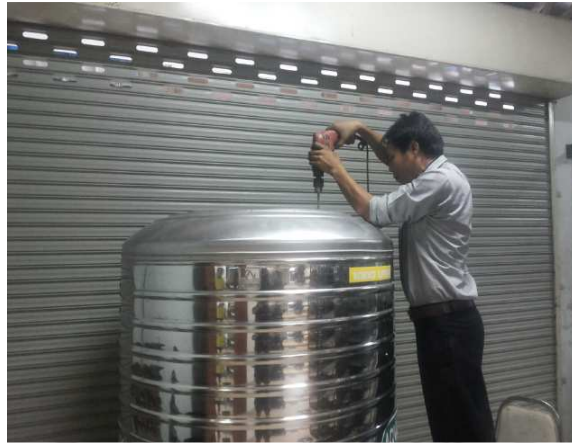
ภาพภาคผนวกที่ ก.4 การเจาะรูสร้างฝาครอบถังหมักแก๊ส