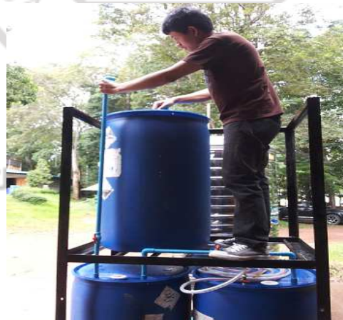
ภาพภาคผนวกที่ ก.9 ประกอบระบบการเดินท่อแก๊สชีวภาพ 1