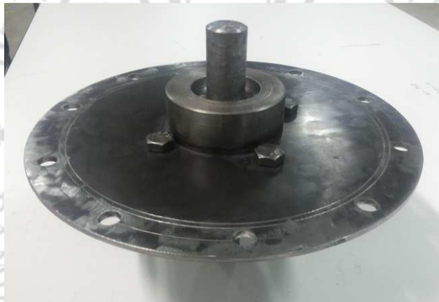
ภาพภาคผนวกที่ ก.5 ชุดกันรั่วและฝาครอบพร้อมแกนเพลาสำรองถังหมักแก๊ส