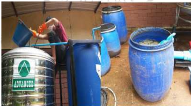
ภาพที่ 3.12 การเติมวัสดุลงในถังหมักแก๊สชีวภาพ