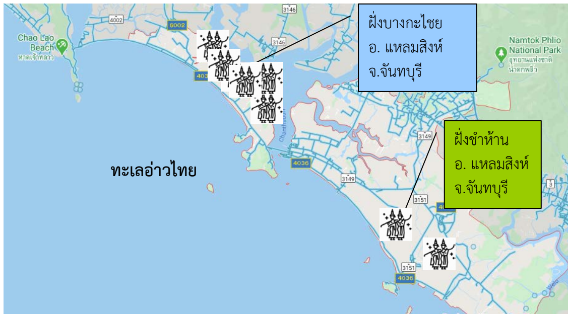
ภาพที่ 2.1 การกระจุกตัวของศิลปะละครเท่งตึก 2 ฝังบ้างอเภอแหลมสิงห์ จังหวัดจันทบุรี