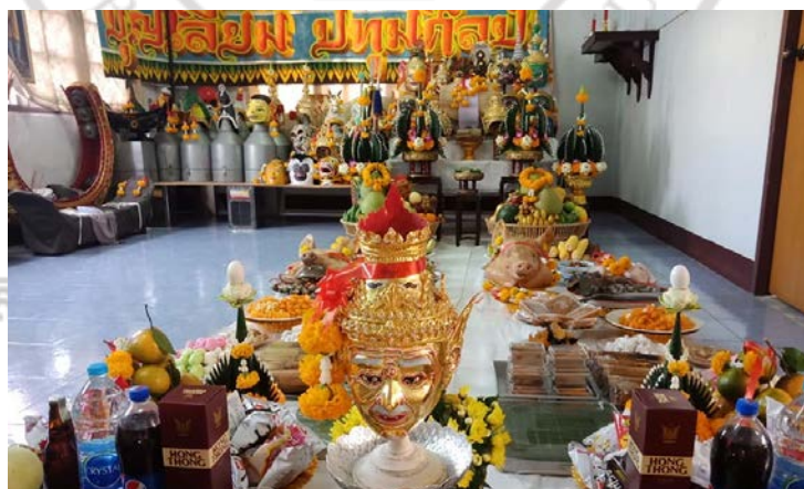
ภาพที่ 3.1 ข้อมูลประเภทวัตถุในงานพิธีกรรมการไหว้ครูละครเท่งต๊ก

ข้อมูลประเภทวัตถุ เป็นการเลือกศึกษาวัสดุอุปกรณ์ที่เกี่ยวข้องกับพิธีกรรมไหว้ครูของศิลปินละครเท่งต๊ก ซึ่งข้อมูลประเภทวัตถุดังกล่าวจะเป็นหลักฐานในการอธิบายปรากฏการณ์ที่เกิดขึ้นในพิธีกรรมการไหว้ครู ได้แก่ เครื่องสังเวท-เครื่องบูชา อุปกรณ์สิ่งของที่ต้องใช้ประกอบพิธีกรรมการไหว้ครู ปฎิมากรรมสิ่งศักดิ์สิทธิ์ประจำคณะละครเท่งต๊ก สัญลักษณ์เทพสังคีตาจารย์ หรือเศียรครุ ภาพถ่ายครุศิลปินผู้ล่วงลับ เสื้อผ้าการแต่งกายในการประกอบพิธีกรรม และเครื่องดนตรีไทย ดังภาพที่ 3.1