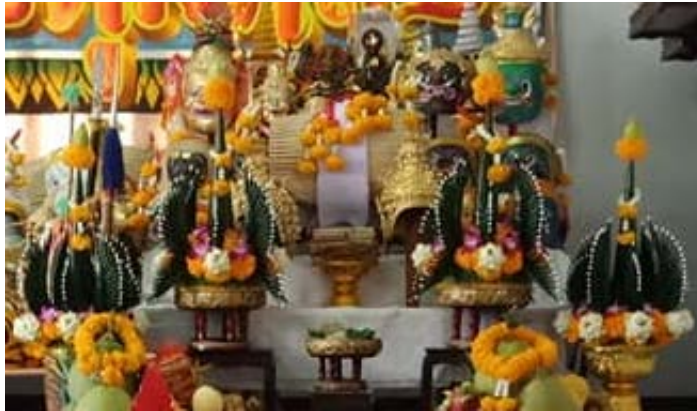
ภาพที่ 4.32 บายศรีถวายสิ่งศักดิ์สิทธิ์ในพิธีไหว้ครูละครแห่งชาติ

บายศรี แบ่งออกเป็น บายศรีปากชาม มีลักษณะเป็นบายศรีขนาดเล็ก ใช้ขามใบย้อมเป็นฐานรอง ประกอบด้วยบายศรีรอบกรวย 4 ด้าน บายศรีใหญ่ หรือบายศรีสู่ขวัญ เขียวขวัญ หรือรับขวัญ มีขนาดใหญ่จัดใส่พาน หรือโตก ทำด้วยบายศรีซ้อนกันลดหลั่นเป็นรูปแบบต่าง ๆ หลายชั้น ซึ่งการนับชั้นบายศรีจะนับตัวที่พับกลับแหลมคล้ายนมสาว รวมกับยอดตัวแรก นิยมจัดเป็นจำนวนคี่ 3 ชั้น 5 ชั้น 7 ชั้น และ 9 ชั้น โดยบายศรี 3 ชั้น หมายถึง การบูชาพระรัตนตรัย เทพเจ้าตรีมูรติ บายศรี 5 และ 7 ชั้น เปรียบเสมือนภาคทั้ง 5 และ 7 ของพระพรหม และ 9 ชั้น แสดงถึงความเจริญก้าวหน้า เป็นมงคลสูงสุดในการดำรงชีวิต ดำเนินกิจการใดก็จะก้าวหน้า