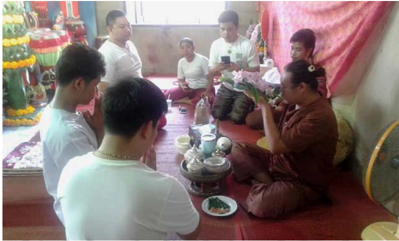
ภาพที่ 4.17 เจ้าภาพถวายของบูชาครูผ่านพราหมณ์เข้าทรงเจ้า ผู้เป็นตัวแทนสิ่งศักดิ์สิทธิ์