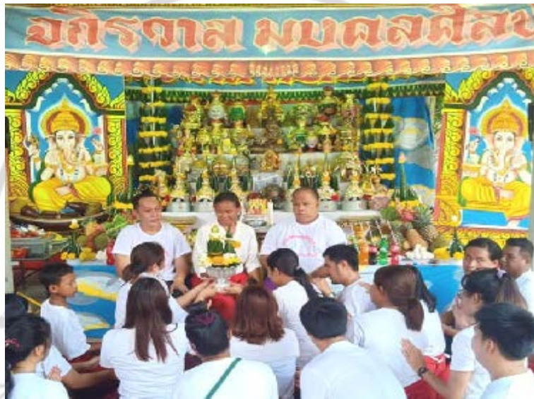
ภาพที่ 4.25 ศิลปินชั้นครูละครแห่งชาติรับพานขอขมาในพิธีไหว้ครูละครแห่งชาติจากลูกศิษย์

มากพร้อมด้วยบาร์มีเป็นที่นับถือของบรรดาเหล่าสมาชิกศิลปินแห่งชาติ โดยหัวหน้าคณะละคร เป็นผู้ที่มีทักษะความสามารถในการสื่อสารเพื่อการโน้มน้าวใจ มีความรู้ ทักษะคติ ธรรมชาติของละครแห่งชาติ เป็นบุคคลผู้มากประสบการณ์จนกลายเป็นครูละคร หรือหัวหน้าคณะละครแห่งชาติ นอกจากจะเป็นผู้ถ่ายทอดวิชาความรู้ ทักษะคติ และทักษะเกี่ยวกับละครแห่งชาติแล้ว ยังได้รับความไว้วางใจจากผู้ชมผู้ยอมรับในความรู้ความสามารถของหัวหน้าคณะละคร ดังภาพที่ 4.25