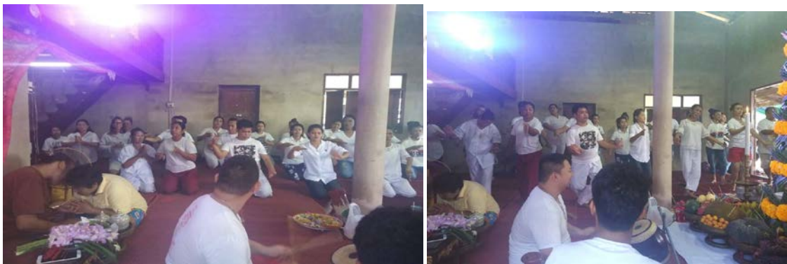
ภาพที่ 4.19 บรรดาศิษย์ละครแห่งตุ๊กรำถวายมือบูชาครู และสิ่งศักดิ์สิทธิ์

จากนั้นลูกศิษย์ทุกคนได้มาร่วมงานไหว้ครูรำแม่บท 12 ท่า ถวายครูบาอาจารย์ ดังภาพที่ 4.19