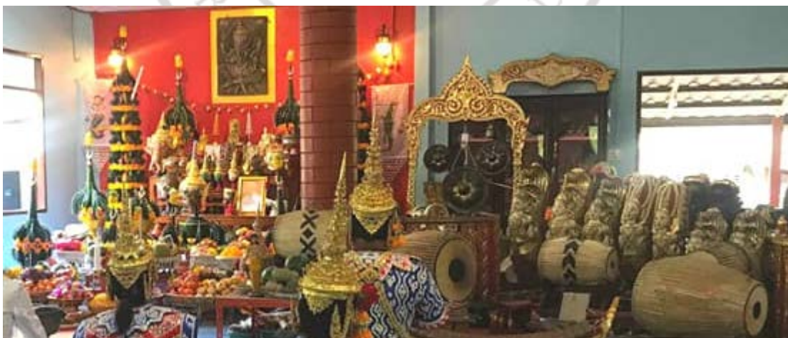
ภาพที่ 4.27 เนื้อหาสาระที่เป็นสัญลักษณ์ต่าง ๆ ในงานพิธีกรรมไหว้ครุละครเท่งตุ๊ก

เนื้อหาสาระ การประกอบพิธีกรรมการไหว้ครุละครเท่งตุ๊ก พบว่า ส่วนที่เป็นเนื้อหาสาระจาก การประกอบพิธีกรรม ได้แก่ เศียรครูเทพเจ้า สิ่งศักดิ์สิทธิ์ บทสวดมนต์ บทสวดอัญเชิญเทพเจ้า และสิ่ง ศักดิ์สิทธิ์ ทำรำถวายมือ เครื่องสังเวท และเสียงดนตรีบรรเลงเพลงหน้าพาทย์ต่าง ๆ เพื่อใช้ประกอบพิธี อัญเชิญเทพยดา และสิ่งศักดิ์สิทธิ์ เสมือนหนึ่งการเสด็จมาของเทพเจ้าผู้ศักดิ์สิทธิ์ที่เกี่ยวข้องกับงานไหว้ ครูแทบทั้งสิ้น จากการศึกษาพิธีกรรมการไหว้ครูของคณะละครเท่งตุ๊ก พบว่า มีสัญลักษณ์ที่สำคัญที่ เป็นองค์ประกอบของพิธีไหว้ครูที่สังเกตได้ คือ เศียรเทพเจ้า ครูดนตรี-นาฏศิลป์ เครื่องสังเวท-เครื่อง กระยาบวช ดังภาพที่ 4.27