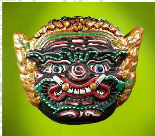
ภาพที่ 4.30 เคียรพ่อแก่ (พระฤๅษีนารอด) และพ่อครู (พระพิราพ) ที่มา. พระคาถาบูชาพ่อแก่ (2558), เครื่องรางไม้รู้ที่ทุกประเภท (2556)

จากการศึกษาสัญลักษณ์ความเชื่อเรื่องครู ของศิลปินละครเท่งต๊ก สรุปได้ว่า เคารพ และ ศรัทธาสืบต่อกันสี่ชั่วอายุคน ทั้ง 4 กลุ่ม คือ (1) กลุ่มเทพตรีมูรติ ได้แก่ พระอิศวร พระนารายณ์ และพระพรหม (2) กลุ่มครูเทพสังคีต หรือเทพคิตาจารย์ ได้แก่ พระปัญจสิงขร พระปรคนธรรพ พระวิศุกรรม พระพิราพ (3) กลุ่มเทพเจ้า และพระฤๅษี ได้แก่ พระพิฆเนศวร์ พระฤๅษีนารอด พระฤๅษี 108 องค์ และ (4) กลุ่มครูละครเท่งต๊กผู้ล่วงลับตามเชื้อสาย เครื่องญาติ และมีไช้เครื่องญาติคณะละคร ทั้งนี้ภายใต้ บริบทความเป็นท้องถิ่นวิถีชีวิตแบบชนบท จากการศึกษาจุดร่วมความศรัทธาที่มีต่อสิ่งศักดิ์สิทธิ์ของ คณะละครเท่งต๊กทั้ง 4 คณะ คือ ส. บ้วน้อย มนัสชัยวัฒนา จักวาลมงคลศิลป์ และรวมดาวรุ่งดาราศิลป์ พบว่า พระฤๅษีนารอด หรือพระฤๅษีภรตมุนี ซึ่งศิลปินเท่งต๊กเรียกว่า “พ่อแก่” คือ สิ่งศักดิ์สิทธิ์ และความเชื่อของคณะละครเท่งต๊ก โดยมีนัยยะความหมายถึง บุคคลผู้สร้างสรรค์อารมณ์ ความรู้สึกให้ ศิลปินเท่งต๊กแสดงได้อย่างเต็มความสามารถ เสมือนหนึ่งเป็นญาติผู้ใหญ่ที่ศิลปินเท่งต๊กให้ความเคารพ นับถือ นิยมนำเครื่องสักการะไหว้ หรือบอกกล่าวขออนุญาต ขอพรก่อนการแสดง การจัดพิธีกรรมการ ไหว้ครู แสดงออกถึงความกตัญญูตเวทีต่อครู สำนึกในบุญคุณของครูผู้ให้ความรู้ ความเชื่อ และทักษะ