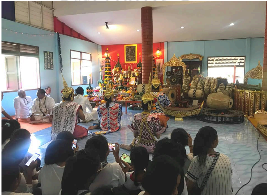
ภาพที่ 4.23 การสื่อสารความเชื่อระหว่างบุคคลในกลุ่มศิลปินละครเท่งต๊ก

จากแนวคิดเบื้องต้นดังกล่าวจึงนำมาเป็นกรอบแนวทางในการวิเคราะห์การสื่อสารความเชื่อระหว่างบุคคลในกลุ่มศิลปินละครเท่งต๊ก พบว่า การสื่อสารความเชื่อระหว่างบุคคลเป็นพฤติกรรมความเชื่อของกลุ่มศิลปินละครเท่งต๊กที่มีประสบการณ์ร่วมกันในพิธีกรรมการไหว้ครู การสื่อสารความเชื่อระหว่างบุคคลจะเกิดขึ้นต่อเนื่องจากระดับการสื่อสารภายในบุคคลของศิลปินละครเท่งต๊ก ศรัทธา และเชื่อในสิ่งศักดิ์สิทธิ์ วิทยุณครละครเท่งต๊กมารวมตัวกันเพื่อรวมพลังแห่งการสร้าง ความมั่นคงทางจิตใจที่สูงขึ้น ดังภาพพิธีกรรมการไหว้ครูเท่งต๊กภาพที่ 4.23