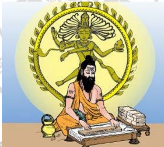
ภาพที่ 4.9 การจดบันทึกตำรานาฏยศาสตร์โดยพระภรตฤๅษี

พระอิศวร หรือพระศิวะ เป็นเทพเจ้ายุคหลังพระอินทร์ จากคัมภีร์ไตรเพท กำเนิดองค์เทพ ชื่อ “พระรุทระ” มีอำนาจมาก ริมฝีปากงาม ร่างกายแข็งแรง ปราดเปรียว มีความหนุ่ม และครองโลก ไม่รู้จักชรา ความเป็นสิทองแดง แต่ก็ปรากฏในรูปร่างอื่น ๆ ได้เสมอ พระอิศวร ตามศาสนาพราหมณ์ถือว่าเป็นผู้ทำลาย ผู้ทำให้สูญ บรรดาสรรพสัตว์ไม่ตายสูญ ถือเป็นกาบท่องเที่ยวในวัฏสงสาร หรือการสิ้นสูญ แล้วถือกำเนิดใหม่ เป็นเทพเจ้าแห่งการทำลายล้างเพื่อให้สะอาดปราศจากมลทิน พระอิศวรมีกายเป็นสีเขียว พระศอ (คอ) เป็นสีนิล มุ่นเศทอย่างฤๅษี มี 2 กร หรืออาจจะมี 4 กร 8 กร 10 กร มี 3 เนตร หรือดวงตาที่สามอยู่กึ่งกลางระหว่างคิ้ว (พระนลาฏ) มีพระจันทร์เสี้ยวติดเหนือนลาฏ ทรงสังวาลเป็นงู และทรงสายธนูรำ มีอาสนะเป็นหนังเสือ มีภูติผีเป็นบริวาร ในทางศิลปะพบว่าตามตำนานพระอิศวร ประสงค์จะแสดงการพ้อนรำให้เป็นแบบฉบับ จึงเชิญพระอุมา ซายาให้ประทับเป็นประธานเหนือสุวรรณบัลลังก์ พระสุรัสวดีตีพิณ พระอินทร์เป่าขลุ่ย พระพรหมตีฉิ่ง พระลักษมีขับร้อง และพระนารายณ์ตีโทน พระภรตฤๅษีได้รับเทวบัญชาให้จดบันทึก และแต่งตำราสั่งสอนแก่เหล่ามนุษย์จนเกิดเป็นตำรานาฏยศาสตร์ และบังเกิดเป็นเทวรูปพระอิศวรปางพ้อนรำท่าต่าง ๆ 108 กระบวนท่า บ้างเรียก “ศิวนาฏราช” ดังภาพที่ 4.9