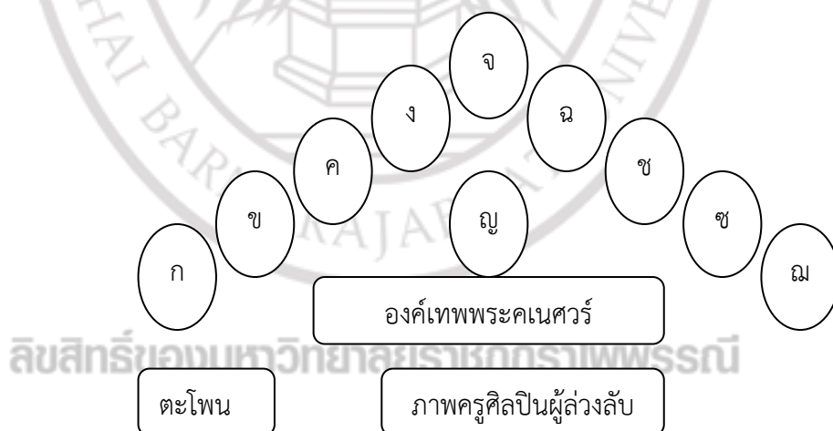
ภาพที่ 4.12 แผนผังการจัดตั้งเทพสังคีตอาจารย์ แบบ 9 เคียร

จากภาพที่ 4.11 สามารถแสดงตำแหน่งการจัดวางตามแผนผังลักษณะการจัดตั้งเทพสังคีตอาจารย์ ซึ่งแต่ละองค์จะเรียกขานนาม ดังภาพที่ 4.12