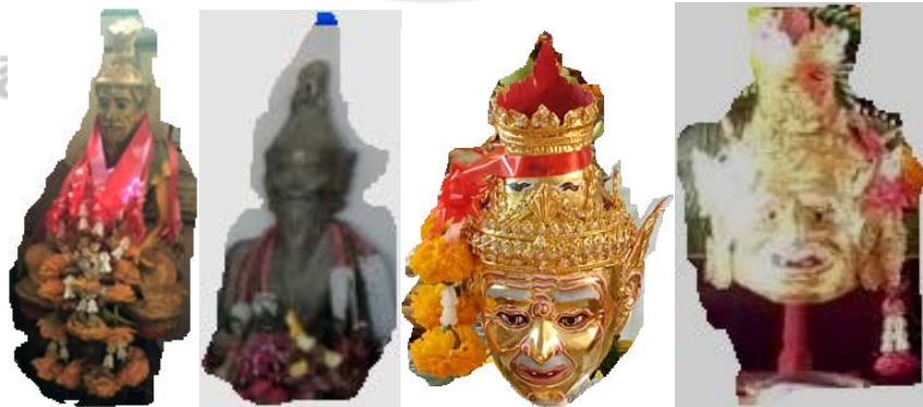
ภาพที่ 4.28 ปฐิมากรรมปูนปั้นรูปเคารพฤๅษีภรตมุนี และหัวโขนของศิลปินแห่งชาติ

สัญลักษณ์ความเชื่อเรื่องครูของศิลปินละครแห่งชาติ ถูกประกอบสร้างความหมายที่สร้างขึ้นจาก ความเชื่อเกี่ยวกับเทพสังคีตอาจารย์ โดยเฉพาะอย่างยิ่งความศรัทธาที่มีต่อพระฤๅษีนารอด หรือพระ นารทฤๅษี ซึ่งในทางนาฏศิลป์เรียกว่าพ่อแก่ (พระฤๅษีภรตมุนี) ว่าเป็นครูของละครแห่งชาติ ซึ่งจากการ สังเกตหิ้งบูชาสิ่งศักดิ์สิทธิ์ พบว่าส่วนใหญ่คณะละครแห่งชาติทั้ง 4 คณะละคร ได้แก่ คณะ ส. บัณฑิต คณะมนัสชัยวัฒนา คณะจักรวาลมงคลศิลป์ และคณะรวมดาวรุ่งดาราศิลป์ มีการบูชาพระฤๅษีภรตมุนี ถูกสร้างออกมาในลักษณะปฐิมากรรมปูนปั้น และเศียร หรือหัวโขน ดังภาพที่ 4.28