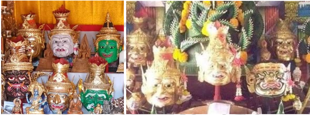
ภาพที่ 4.29 เคียรบรมครูปู่ฤๅษีบนแท่นบูชาของคณะละครเท่งตึก คณะจักรวาลมงคลศิลป์ (ซ้าย) และคณะรวมดาวรุ่งดาราศิลป์ (ขวา)

หลวง คือ วิทยาลัยนาฏศิลป์ ทำให้เกิดความพิถีพิถันให้การให้ความสำคัญกับรูปหัวโขน หรือคีตาจารย์อย่างสมบูรณ์แบบ ผ่านสัญญาณที่แสดงออกมาจากหิ้งบูชาเทพสังคีตาจารย์ของทั้งสองคณะ ได้แก่ พระปัญจสิงขร พระปรคนธรรพ พระวิศุกรรม พ่อแก่-พ่อครู ดังภาพที่ 4.29