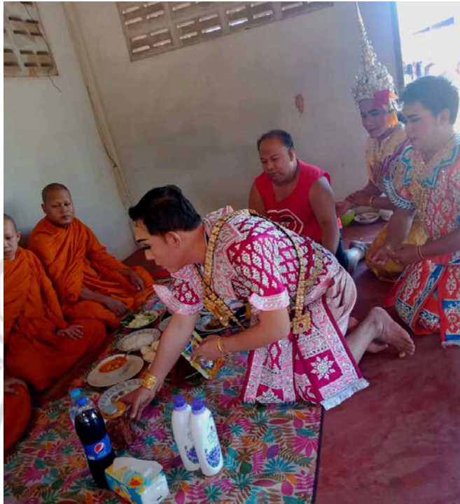
ภาพที่ 4.20 ศิลปินนักแสดงถวายภัตตาหารแด่พระภิกษุสงฆ์ในงานไหว้ครูหลังจากเสร็จพิธีพราหมณ์

จากนั้นทุกคนที่มาร่วมงานก็รับประทานอาหารกลางวัน และดำเนินการแสดงละครเท่งต๊ก เพื่อถวายครูบาอาจารย์และสิ่งศักดิ์สิทธิ์ และเพื่อความบันเทิงแก่ผู้เข้าร่วมงานดังภาพที่ 4.21