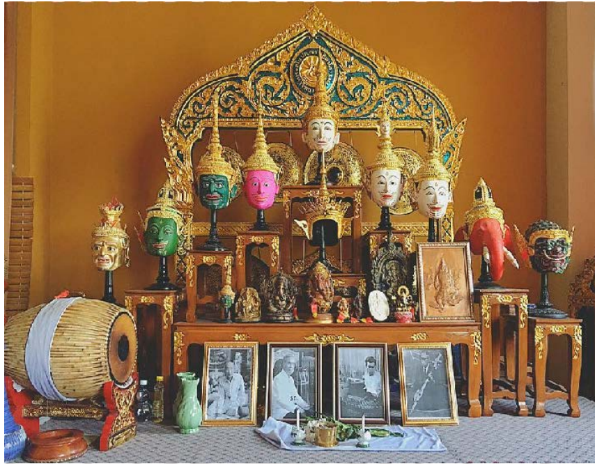
ภาพที่ 4.11 หิ้ง/แท่นบูชาครูดนตรี-ศิลปะสะท้อนความเชื่อที่มีต่อสิ่งศักดิ์สิทธิ์ประเภทต่าง ๆ

จากภาพที่ 4.11 สามารถแสดงตำแหน่งการจัดวางตามแผนผังลักษณะการจัดตั้งเทพสังคีตอาจารย์ ซึ่งแต่ละองค์จะเรียกขานนาม ดังภาพที่ 4.12