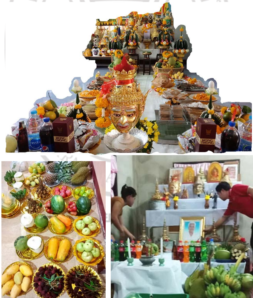
ภาพที่ 4.31 เครื่องสักการะบูชาสิ่งศักดิ์สิทธิ์ในพิธีกรรมไหว้ครุละครเท่งตุ๊ก

เครื่องสักการะสังเวช และเครื่องกระยาบวช จึงเป็นความหมายที่แสดงออกถึงการจัดเลี้ยงต้อนรับครูอาจารย์ แสดงออกถึงความบริบูรณ์ทั้งเครื่องอุปโภค และบริโภค มีกินมีใช้ไม่อดอยาก ไม่ลำบาก ไม่จน ดังนั้น การจัดสิ่งของเครื่องสักการะสังเวช และเครื่องกระยาบวชจำเป็นต้องจัดสิ่งของที่มีชื่อเรียกที่เป็นมงคล เกี่ยวข้องกับเรื่องเงิน ๆ ทอง ๆ ความมั่นคงในชีวิตความเป็นอยู่โดยมีฐานะที่ดี ดังภาพที่ 4.31