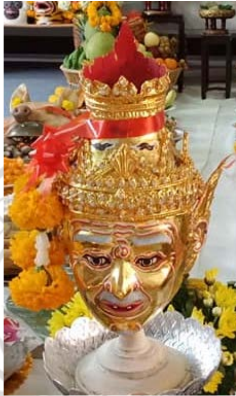
ภาพที่ 4.10 เศียรพระภคตมุนีในบริเวณประกอบพิธีกรรมการไหว้ครู

4. ครูละครเท่งตึกผู้ล่วงลับ หมายถึง ครูมนุษย์ที่เมื่อครั้งยังมีชีวิตอยู่เคยอบรมสั่งสอน และทำกิจประโยชน์แก่ศิลปินผู้รับการสืบทอดละครเท่งตึก ครั้นเสียชีวิตลง ศิลปินในฐานะศิษย์จำเป็นต้องรำลึกถึงคุณงามความดีที่เคยได้รับจากครูละครเท่งตึกผู้ล่วงลับ ขณะที่มีการจัดพิธีกรรมการไหว้ครูศิษย์ผู้เป็นศิลปินละครเท่งตึกนิยมนำภาพถ่ายครูดนตรีที่เสียชีวิตแล้วเหล่านั้นตั้งบนแท่นบูชาพร้อมกับเทพสังคีตอาจารย์ และเทพนาฏยาจารย์ เพื่อแสดงความระลึก ความกตัญญู อย่างไรก็ตามยังมีการแสดงความเคารพครูเครื่องดนตรี แสดงความสำนึกคุณค่าในเครื่องดนตรีไทยที่เป็นสื่อกลางระหว่างผู้เล่นกับผู้ฟังในฐานะเครื่องอึ่ง นิยมกราบไหว้ และจัดวางบนแท่นบูชาในปะรำพิธีไหว้ครูร่วมกับหน้าครู และภาพถ่ายครูผู้ล่วงลับ ด้วยความเชื่อของสังคมไทยเชื่อว่า “ศิษย์ย่อมมีครู” วงการดนตรีนิยมปลูกฝังให้ศิษย์ดนตรี-นาฏศิลป์ยกมือไหว้ กราบ หรือนำพวงมาลัยดอกไม้บูชาเครื่องดนตรีก่อนฝึกซ้อม และทำการบรรเลง โดยเฉพาะอย่างยิ่ง “ตะโพน” คือ สัญลักษณ์แทนพระประคนธรรพ โดยหิ้งบูชาที่สะท้อนความเชื่อในความศรัทธาที่มีต่อครูดนตรี-นาฏศิลป์ ปรากฏดังภาพที่ 4.11