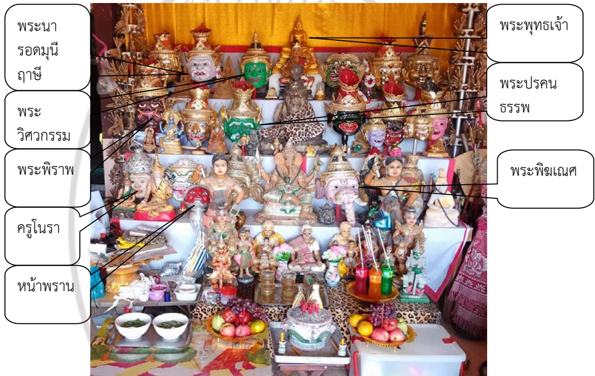
ภาพที่ 4.6 แทนบูชาสิ่งศักดิ์สิทธิ์รวมเทพของคณะละครเท่งตุ๊ก คณะจักรวาลมงคลศิลป์

ความเชื่อที่มีต่อเทพเจ้าและครุของศิลปินละครเท่งตุ๊ก พบว่า มีลักษณะเช่นเดียวกับความศรัทธาที่มีต่อครุดนตรี-นาฏศิลป์ โดยจำแนกสิ่งศักดิ์สิทธิ์ออกเป็น 3 กลุ่ม คือ (1) กลุ่มเทพเจ้ากลุ่มตรีมูรติ (2) กลุ่มเทพเจ้าดุริยเทพ หรือเทพสังคีตอาจารย์ และ (3) กลุ่มเทพเจ้าพระฤๅษี นอกจากนี้ยังศรัทธาศิลปินผู้ล่วงลับ จากการศึกษาแทนบูชาสิ่งศักดิ์สิทธิ์ของคณะละครเท่งตุ๊ก คณะจักรวาลมงคลศิลป์มีการจัดเรียงศิระชะ หรือเศียรตัวแทนสิ่งศักดิ์สิทธิ์ ดังปรากฏภาพที่ 4.6