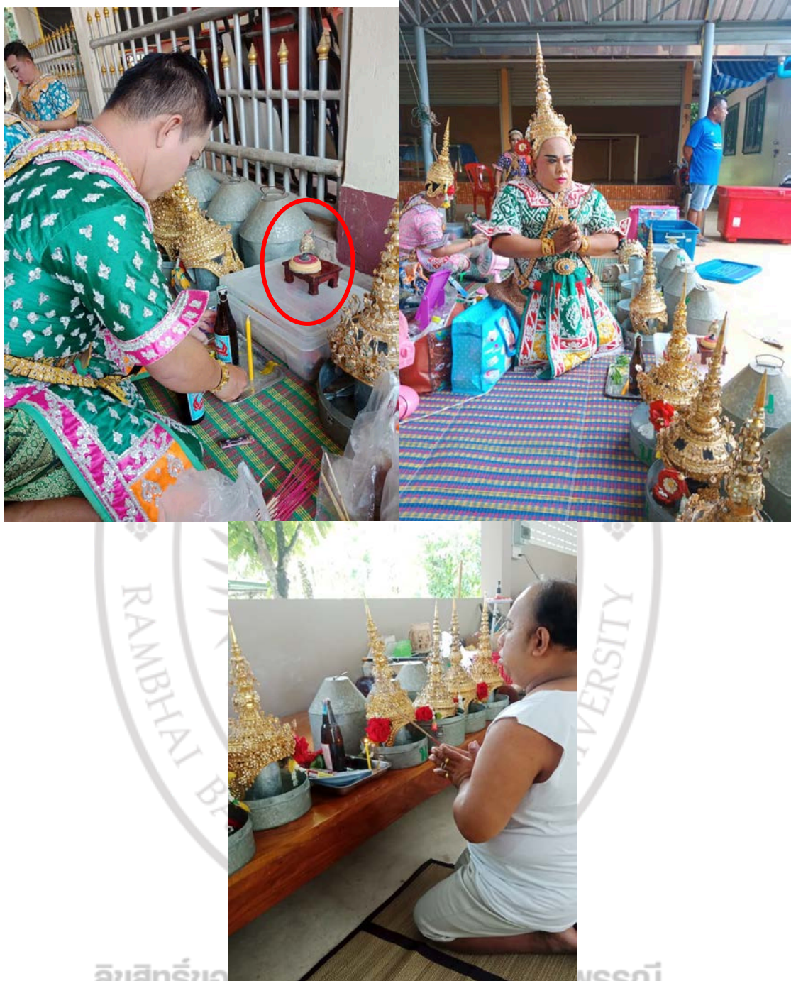
ภาพที่ 4.8 หัวหน้า หรือผู้แทนคณะละครเท่งตึกบวงสรวงบูชาสิ่งศักดิ์สิทธิ์ก่อนทำการแสดง

จากการสำรวจความเชื่อเบื้องต้นสามารถจัดกลุ่มสิ่งศักดิ์สิทธิ์ได้ตามการไหว้ครูดนตรี-นาฏศิลป์ ซึ่งเป็นศาสตร์แห่งการแสดงเพื่อการร้องรำ สิ่งศักดิ์สิทธิ์จึงมีอิทธิพลต่อการสร้างความเชื่อมั่นของศิลปินในการแสดงออก เพื่อสร้างความประทับใจให้กับผู้ชมทั้งผู้ชมที่เป็นมนุษย์ และสิ่งศักดิ์สิทธิ์ ความเชื่อของศิลปินละครเท่งตึกทั้ง 3 คณะละคร คือ คณะ ส. บัวน้อย คณะมนัสชัยวัฒนา และคณะจักรวาลมงคลศิลป์