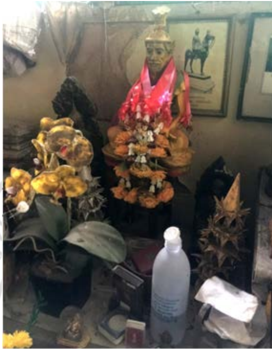
ภาพที่ 4.2 หิ้งบูชาปู่ฤๅษีภรตมุนี บรมครูการละคร ของคณะ ส. บั้วน้อย ที่มา. (บ้านพักศิลปินอาวุโสละครแห่งชาติ คณะ ส. บั้วน้อย)