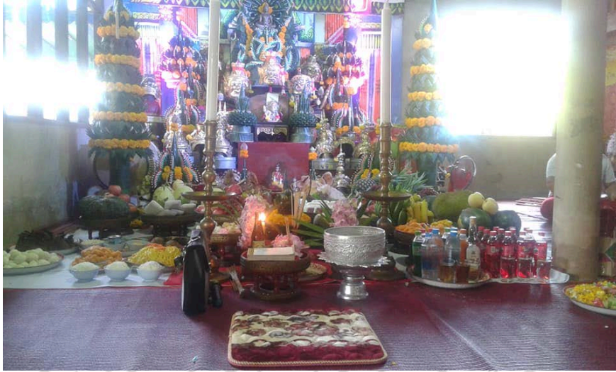
ภาพที่ 4.18 แท่นปรัมพธิ และเครื่องสังเวยสักการะบูชาสิ่งศักดิ์สิทธิ์