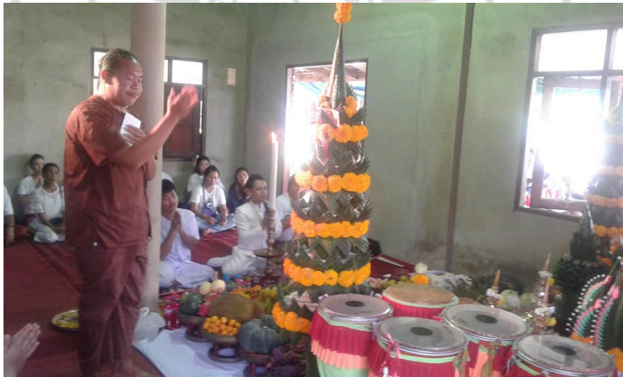
ภาพที่ 4.16 สิ่งศักดิ์สิทธิ์ที่ประทับทรงผู้ช่วยพราหมณ์ผู้เป็นตัวแทนสิ่งศักดิ์สิทธิ์รับการบูชาบายศรี

ตระผลสมรับองค์บรมบครู พระนารายณ์ (ดนตรีบรรเลงทั้งบทสวด)