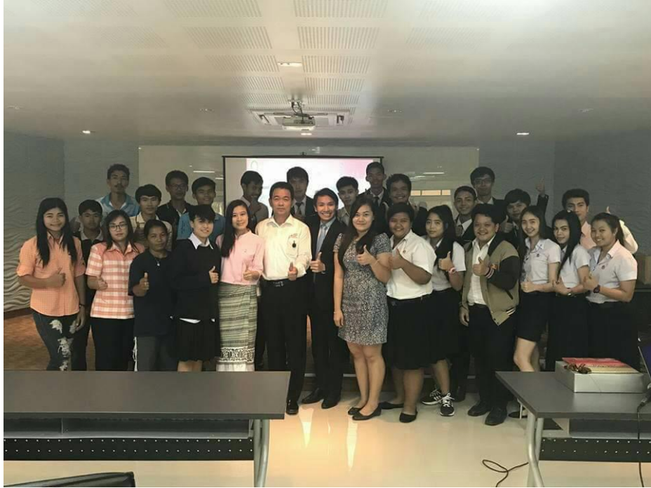
ภาพที่ 4.1 ภาพในการอบรมผู้นำชุมชน ภาพที่ 1