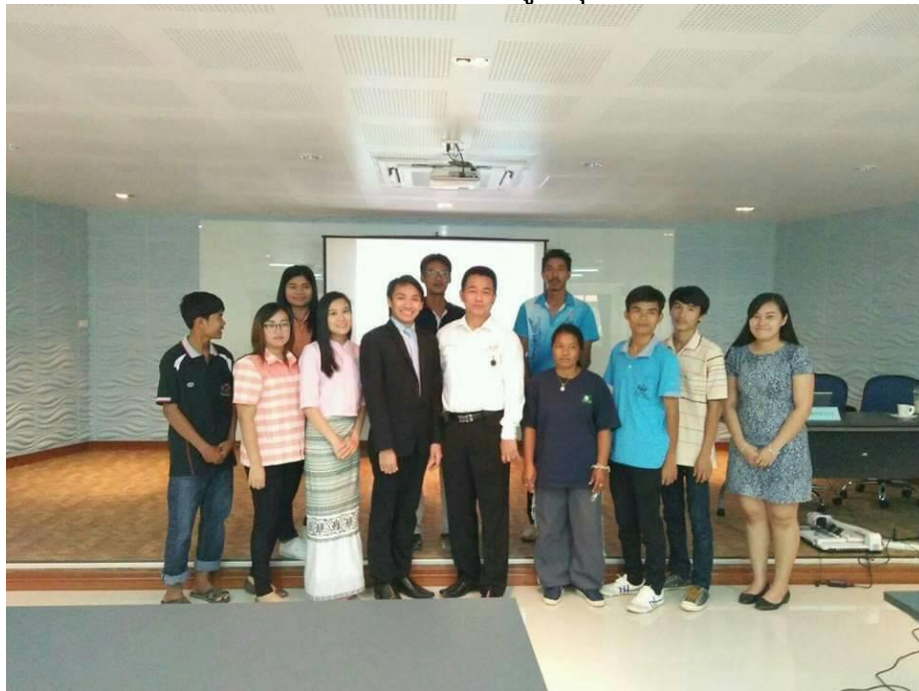
ภาพที่ 4.2 ภาพในการอบรมผู้นำชุมชน ภาพที่ 2