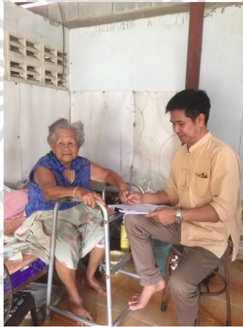
ชาวบ้านที่ได้รับผลกระทบช้างป่า