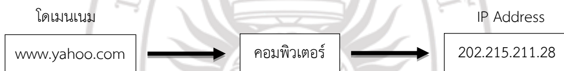
ภาพที่ 2.3 DNS Server

เว็ลด์ไวด์เว็บ หรือเรียกสั้นๆ ว่าเว็บ คือ การให้บริการในรูปแบบนี้คือการเรียกบราวเซอร์ เช่น Internet Explorer หรือ Netscape จากเครื่องของเราและระบุ URL เพื่อใช้ในการอ้างที่อยู่ทีเก็บเว็บ และเมื่อทำการป้อน ชื่อ URL ข้อมูลจะถูกส่งไปที่ DNS Server (Domain Name Server) โดยจะเป็นเซิร์ฟเวอร์ที่ใช้ในการเปลี่ยนชื่อ URL ซึ่งเป็นชื่อที่มีความหมาย เช่น www.yahoo.com, www.google.com เป็นต้น ให้กลายเป็นชื่อแบบตัวเลข หรือ IP Address ดังแสดงในภาพที่ 5 DNS Server