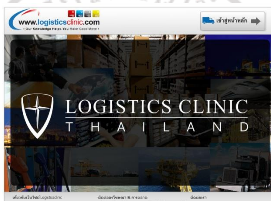
ภาพที่ 2.5 เว็บไซต์โลจิสติกส์คลินิก ให้บริการความรู้และบริการจัดการโลจิสติกส์

จากการศึกษาฐานข้อมูลของหน่วยงานเกี่ยวกับด้านโลจิสติกส์พบว่า มีหน่วยงานหลายหน่วยงานที่ให้ความสนใจเกี่ยวกับการจัดเก็บข้อมูลเพื่อให้ประโยชน์ และเผยแพร่ความรู้หรือภาระของหน่วยงานให้ประชาชนทั่วไปได้เรียนรู้ วัตถุประสงค์ของการสร้างฐานข้อมูลหรือเว็บไซต์ก็จะแตกต่างกันเชิงพาณิชย์หรือกลุ่มเป้าหมาย หากเป็นหน่วยงานเอกชน ก็ต้องการที่จะหากกลุ่มลูกค้าที่สนใจ การรับบริการกิจกรรมทางโลจิสติกส์แบบเต็มรูปแบบ หรือบางส่วน การรับค่าปรึกษาเพื่อให้ลูกค้ามีความสะดวกในการทำงานมากยิ่งขึ้น ประชาสัมพันธ์ธุรกิจด้านโลจิสติกส์ของตนเอง เพื่อสร้างรายได้ ดังแสดงในภาพที่ 2.4