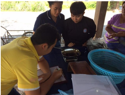
การเก็บข้อมูลจากตัวอย่างปูแสม