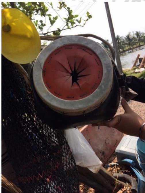
ช่องใส่ปูแสม