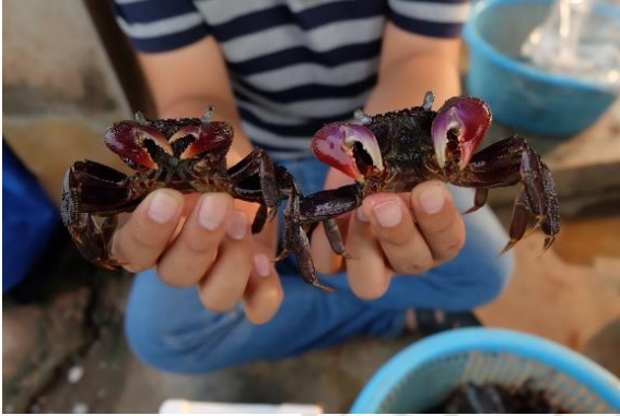
ตัวอย่างปูแสม