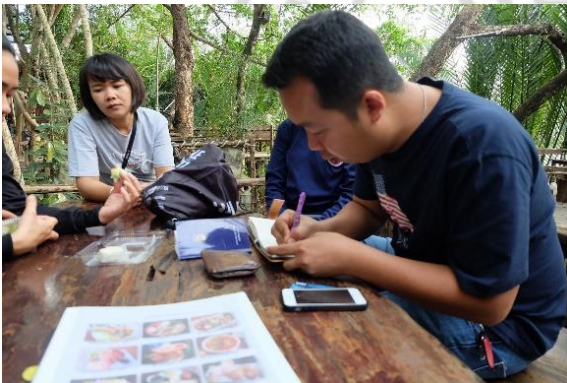
การประชุมวางแผนเก็บข้อมูลภาคสนาม