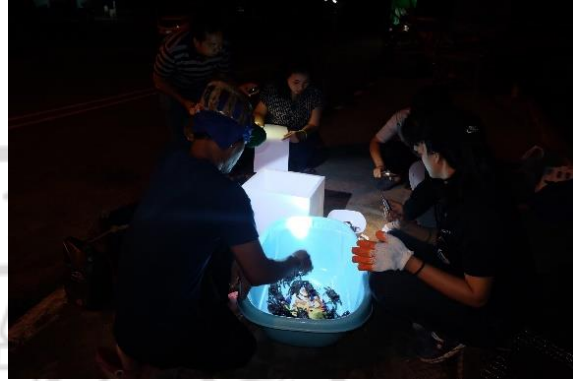
การเก็บข้อมูลปูแสมจากชาวประมง