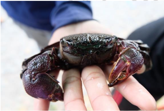
ตัวอย่างปูแสม