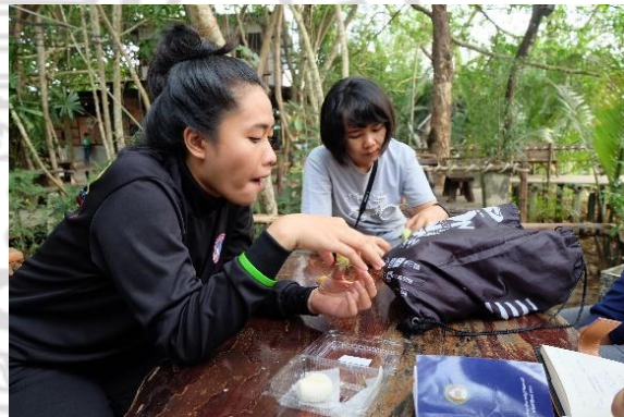
การประชุมวางแผนเก็บข้อมูลภาคสนาม