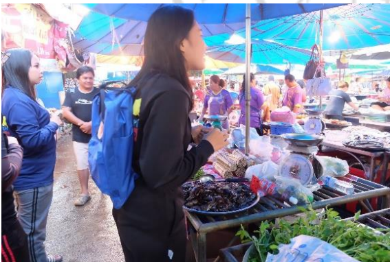
การสำรวจตลาดปูแสม