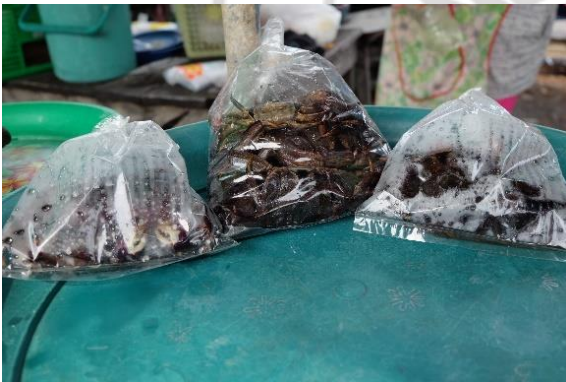
ผลิตภัณฑ์ปูแสมดองเค็ม