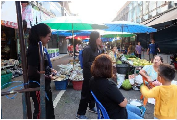
การสำรวจตลาดปุแสม