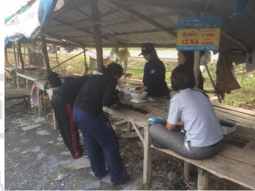
การเก็บข้อมูลจากตัวอย่างปูแสม