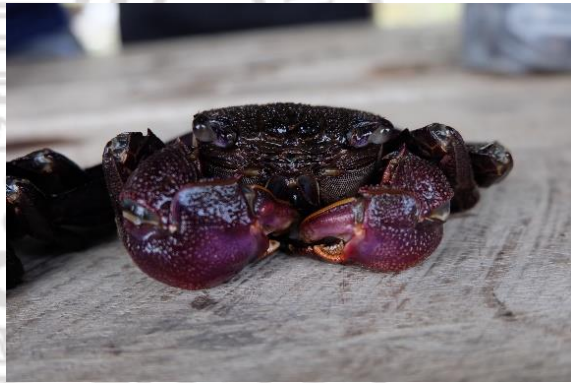
ตัวอย่างปูแสม