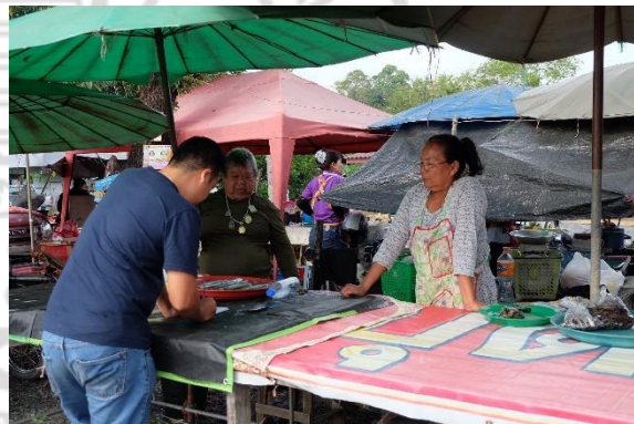
แหล่งรับซื้อปูแสม