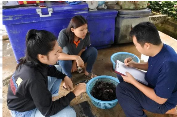
การเก็บข้อมูลจากตัวอย่างปูแสม