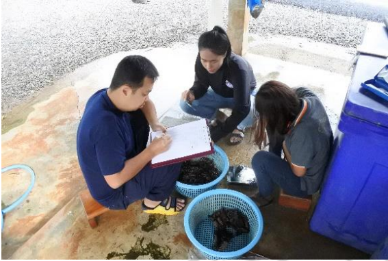
การเก็บข้อมูลจากตัวอย่างปูแสม