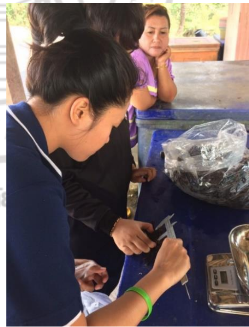
การเก็บข้อมูลจากตัวอย่างปูแสม