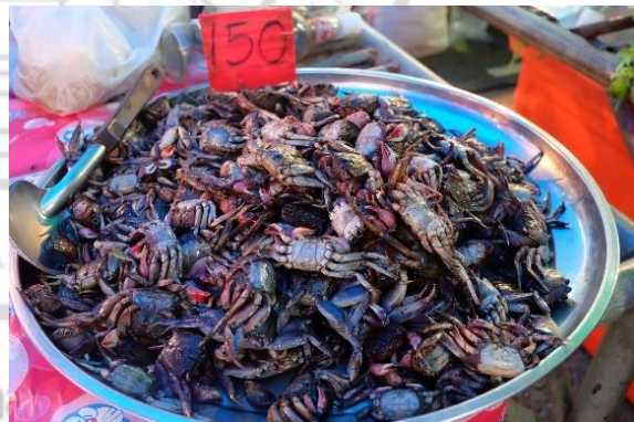
การสำรวจตลาดปูแสม