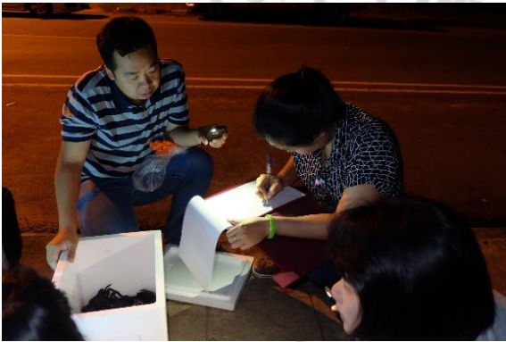
การเก็บข้อมูลปูแสมจากชาวประมง