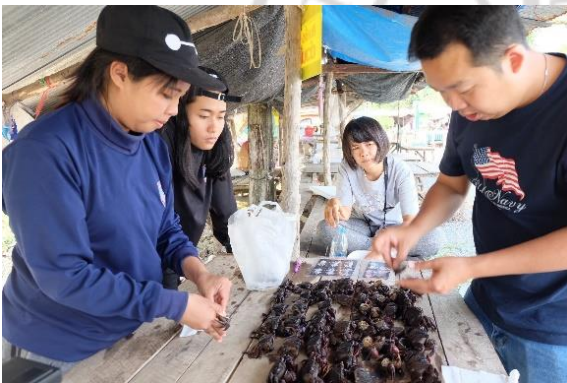
การเก็บข้อมูลจากปูแสม