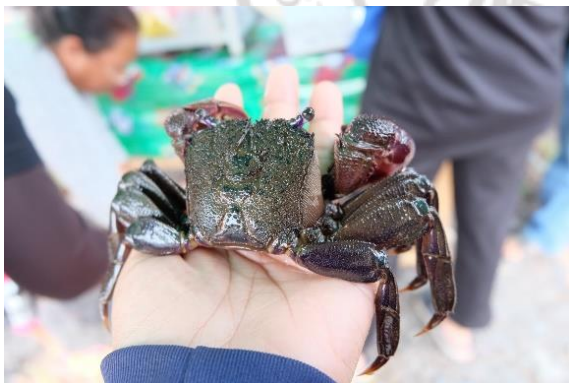
ตัวอย่างปูแสม