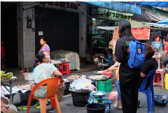
การสำรวจตลาดปุแสม