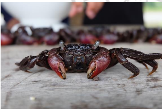
ตัวอย่างปูแสม