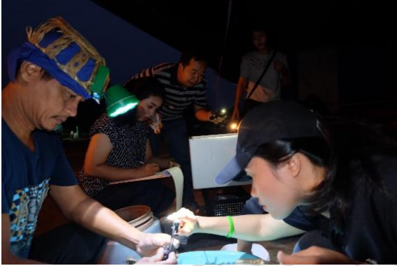
การเก็บข้อมูลปูแสมจากชาวประมง