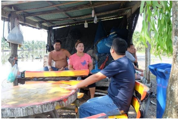
การสัมภาษณ์แหล่งรับซื้อปูแสม