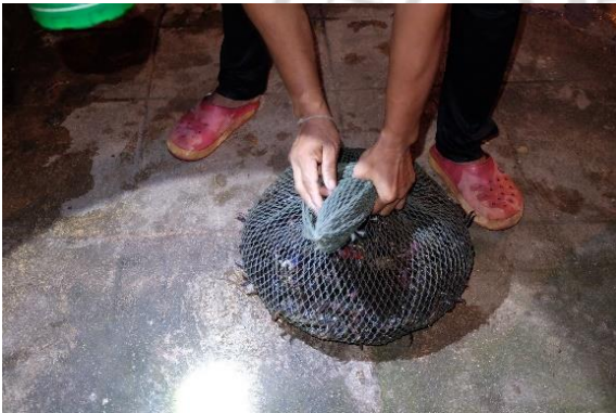
ผลจับปูแสมจากชาวประมง