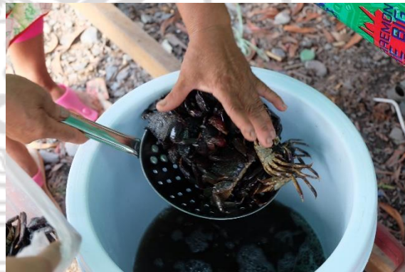
ผลิตภัณฑ์ปูแสมดองเค็ม