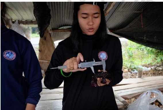
การวัดความกว้างกระดองปูแสม