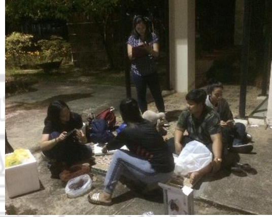
การเดินทางเก็บข้อมูลภาคสนาม