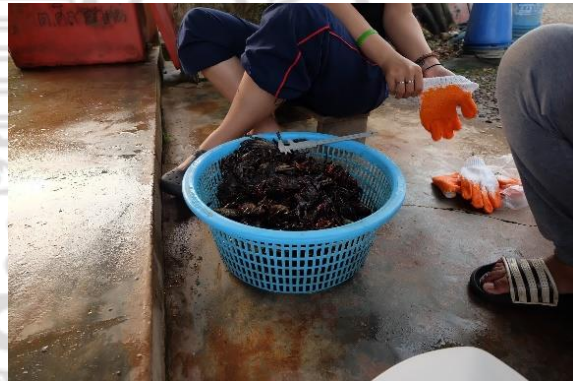
ผลจับปูแสมจากชาวประมง