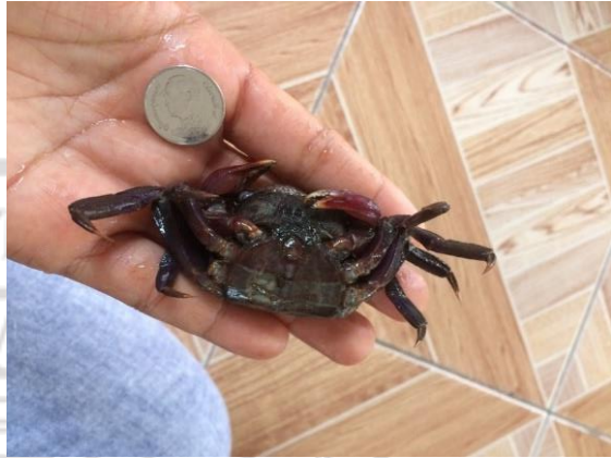
ตัวอย่างปูแสม