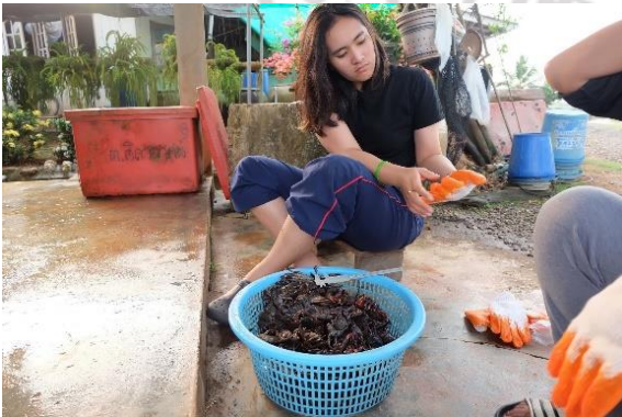
การเก็บข้อมูลจากตัวอย่างปูแสม