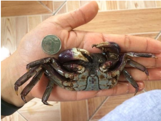
ตัวอย่างปูแสม