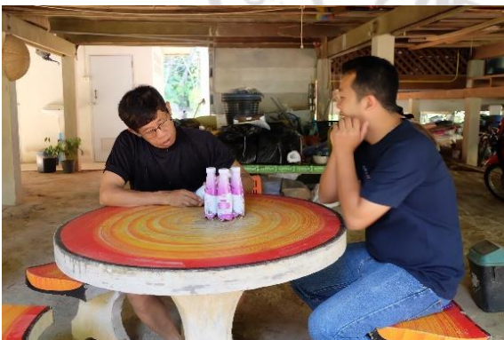
การสัมภาษณ์ปราชญ์ชาวบ้านที่มีความรู้เรื่องปุแสม