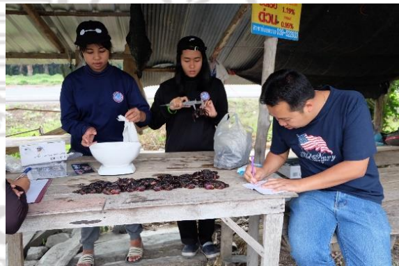
การเก็บข้อมูลจากปูแสม