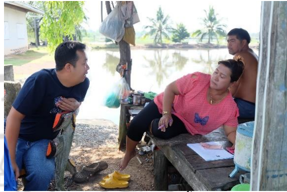
การสัมภาษณ์แหล่งรับซื้อปูแสม