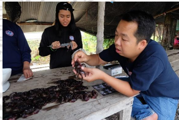
การจำแนกปูแสมภาคสนาม