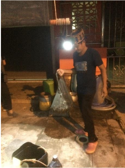
ลักษณะอุปกรณ์สำหรับการประมงปูแสม