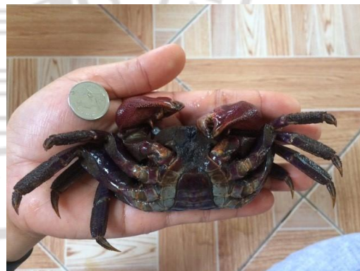
ตัวอย่างปูแสม

ตัวอย่างปูแสมของมหาวิทยาลัยราชภัฏรำไพพรรณี