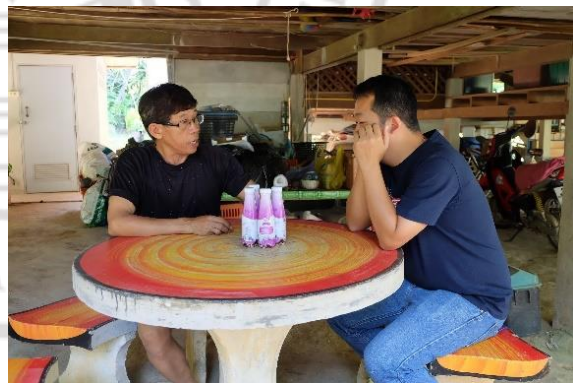
การสัมภาษณ์ปราชญ์ชาวบ้านที่มีความรู้เรื่องปุแสม