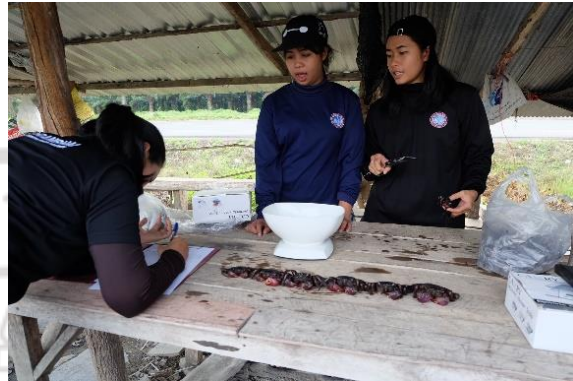
การชั่งน้ำหนักปูแสม