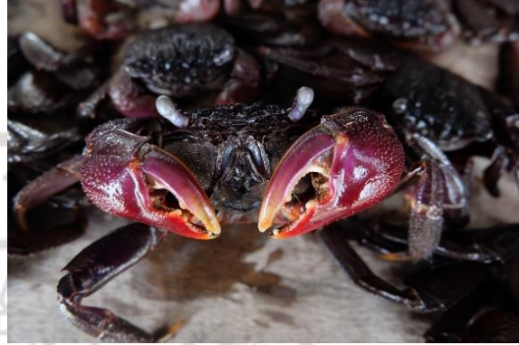
ตัวอย่างปูแสม