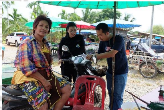
การสำรวจตลาดปุแสม