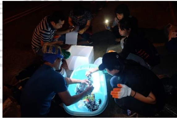
การเก็บข้อมูลปูแสมจากชาวประมง