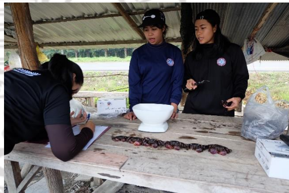
การเก็บข้อมูลจากตัวอย่างปูแสม