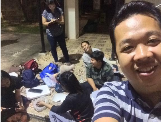
การเดินทางเก็บข้อมูลภาคสนาม