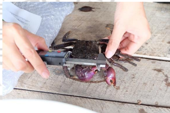
การวัดความกว้างกระดองปูแสม