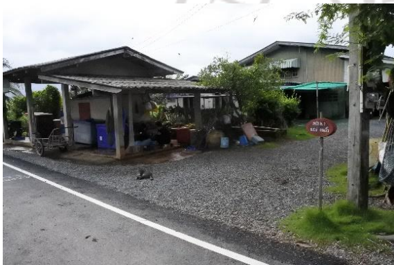
แหล่งรับซื้อปูแสม