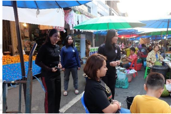
การสำรวจตลาดปุแสม