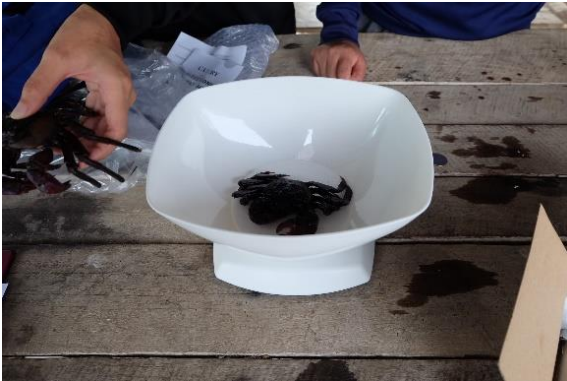
การชั่งน้ำหนักปูแสม