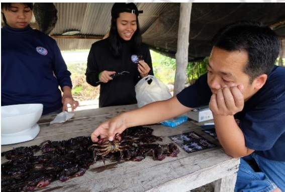
การจำแนกปูแสมภาคสนาม