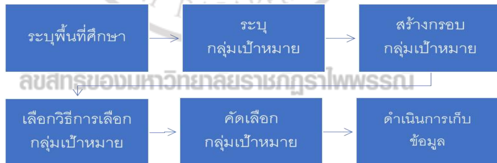
ภาพที่ 3.1 แผนผังการดำเนินงานเก็บรวบรวมข้อมูลวิจัย