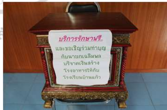
ภาพที่ 4.34 ผู้ป่วยบริจาคเพื่อเป็นค่าวัสดุในการปรุงยา