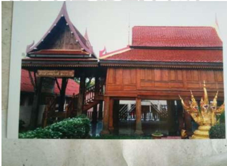
ภาพที่ 4.20 เรือนทรงไทย วัดแหลมมะขาม อยู่อำเภอแหลมงอบ