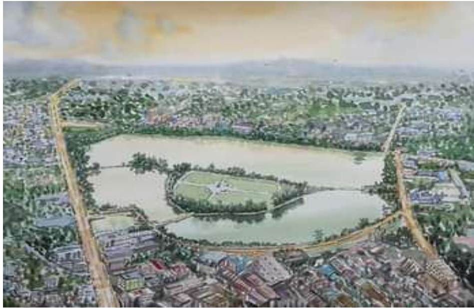
ภาพที่ 4.13 ภาพวาดสวนสาธารณะทุ่งนาชัย