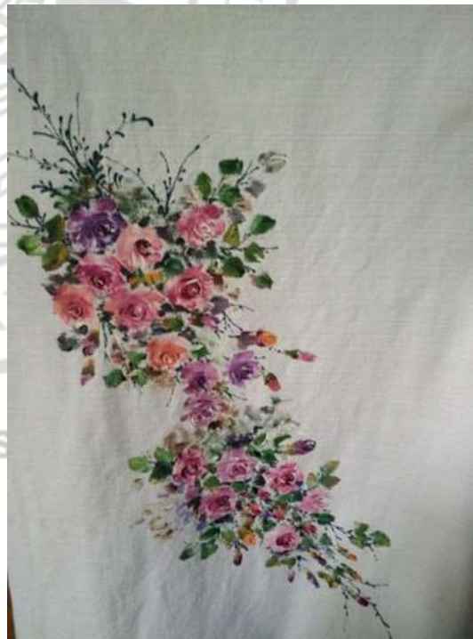
ภาพที่ 4.18 งานเพ้นท์บนเสื้อ และบนพื้นผ้าต่าง ๆ