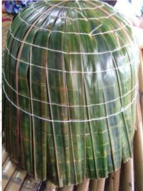
ภาพที่ 4.37 สาธิตการทำอบชิ้นตอนที่ 3

4. เย็บใบจากแต่ละใบให้ติดกันตามรอยที่วงไว้ 12 วง ลักษณะการเย็บมี 2 แบบ แบบปกติจะเย็บจากวงในสุด ให้ครบรอบแล้วมาเริ่มวงที่ 2 ให้ครบรอบและเริ่มวงที่ 3 ไปเรื่อย ๆ อีกแบบจะเย็บแบบวงกันหอย คือ เริ่มจากวงในสุดแล้วต่อเป็นวงที่ 2,3 จนครบ ดังภาพที่ 4.38