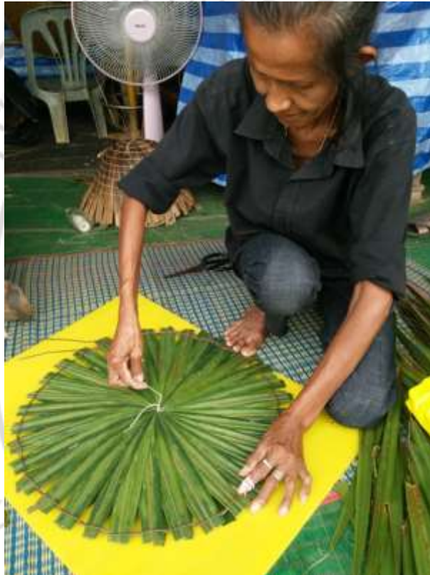
ภาพที่ 4.36 สาธิตการทำอบชิ้นตอนที่ 2

2. ใช้เถาวัลย์เขียว (หญ้านาง) ที่รู้ดใบออกแล้ว จำนวน 2 เส้นความยาวประมาณเส้นละ 1 เมตร นำมายึดปลายใบจากในลักษณะถักโดยเส้นเถาวัลย์เขียว จะไขว้กันแบบขึ้นลงแล้วปลายใบจากถูกหนีบไว้ถักวนไปจนรอบเป็นวงกลม การใช้เถาวัลย์มาเป็นตัวยึดใบจากข้อดี คือใบจากจะไม่ลื่น ดังภาพที่ 4.36