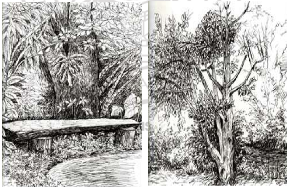
ภาพที่ 4.8 ผลงานภาพวาดลายเส้น