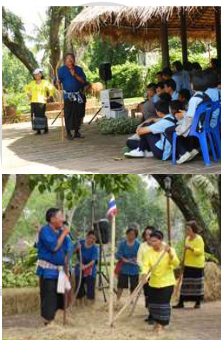
ภาพที่ 4.25 การแสดงหงส์ฟาง

การนวดข้าว เนื้อหาของเพลงจะเกี่ยวข้องกับการเกี่ยวพาราสีของหนุ่มสาว ในเชิงหยอกล้อ หรือ แกมทะเล่ิงทะเล่ิน สร้างความสนุกสนาน สามารถทำงานได้อย่างไม่รู้จักเหน็ดเหนื่อย จึงนำมาเล่น เพื่อให้คลายความเหนื่อยสร้างบรรยากาศและประทับใจแก่คนทั่วไป