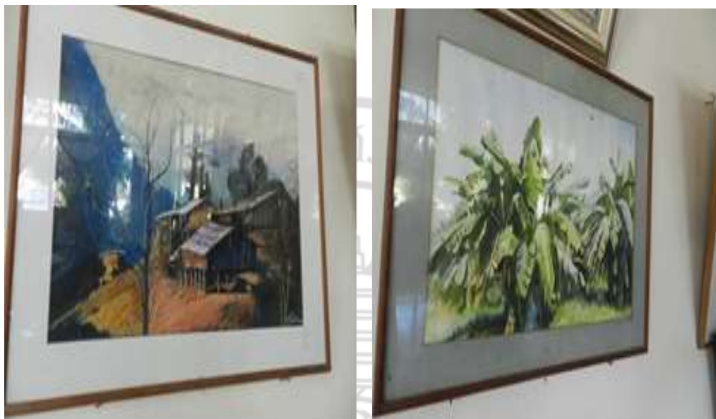
ภาพที่ 4.4 งานวาดเขียนแนวธรรมชาติ