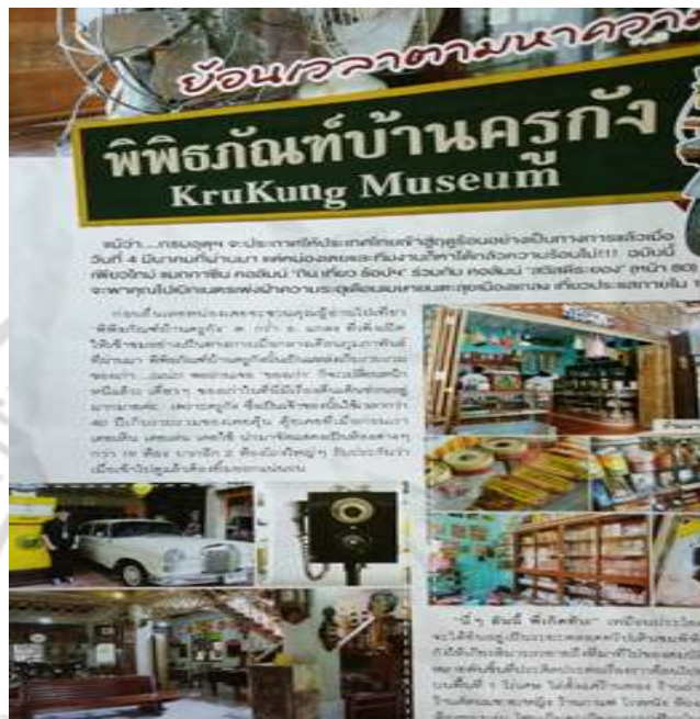
ภาพที่ 4.22 ผลงานที่จัดแสดงในพิพิธภัณฑที่บ้านครูกัง