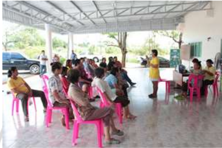
ภาพที่ 4.31 การให้ความรู้เรื่องการปฏิบัติตัวและตัวยาที่ใช้ในการรักษาผู้ป่วย