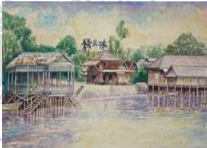
ภาพที่ 4.6 ภาพวาดสีน้ำมันที่สร้างชื่อเสียง

ลักษณะการสอนหนังสือของ อาจารย์อนุสรณ์ เจตน์มงคลนั้น จะเป็นคนพูดน้อย แต่จะเป็นลักษณะการवादให้ดูมากกว่าการสอน โดยอุปนิสัยแล้วไม่ชอบเน้นการพูดจะตอบข้อสงสัยให้สำหรับผู้ ที่สนใจและซักถามเท่านั้น การสอนลักษณะเช่นนี้เป็นการสื่อให้เห็นความตั้งใจ และความทุ่มเทในการทำงานด้านศิลปะเป็นหลัก