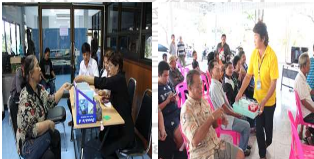
ภาพที่ 4.30 ลงทะเบียนผู้ป่วยก่อนเข้ารับการรักษาโรคสะกดเงิน