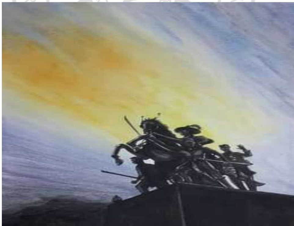
ภาพที่ 4.16 ภาพวาดสีฝุ่น