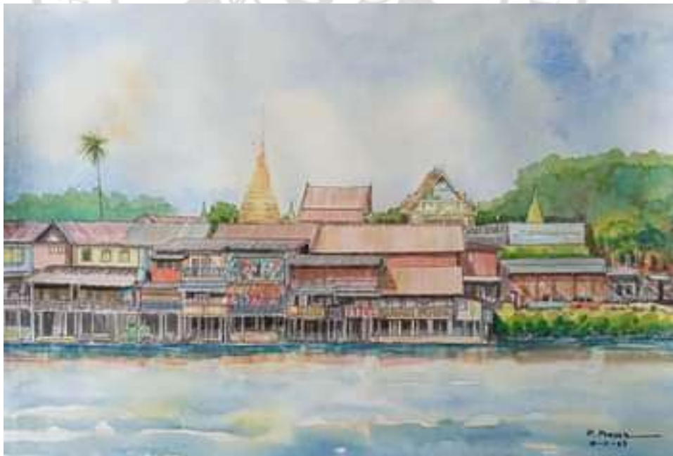
ภาพที่ 4.14 ภาพวาด ริมน้ำจันทบูร