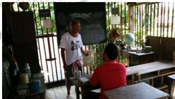
ภาพที่ 4.23 พิพิธภัณฑที่บ้านครูกัง