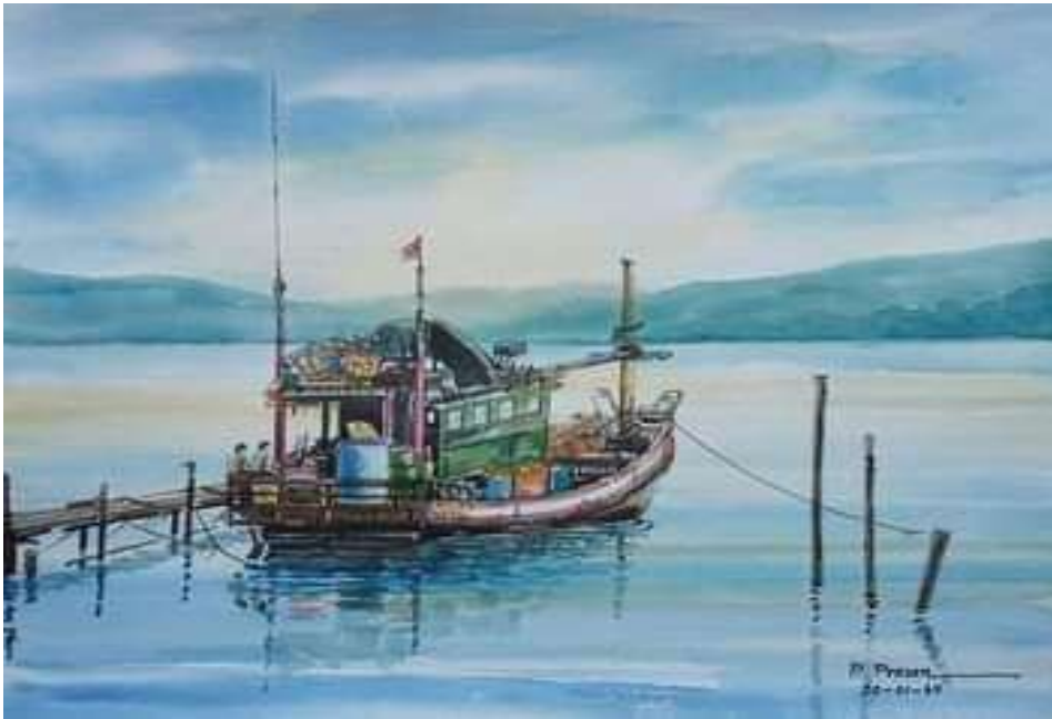
ภาพที่ 4.15 ผลงานสีน้ำ