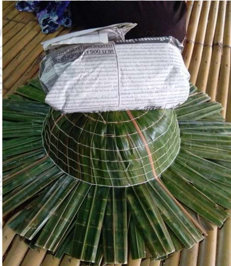
ภาพที่ 4.39 สาคิตการทำงอบขั้นตอนที่ 5

5. เมื่อเย็บถึงวงที่ 6 หรือ 7 จะเห็นว่าบริเวณปลายขอบจะมีรูที่เกิดจากใบจากไม่ชนกัน ก็ให้ใช้ใบจากมาแซมเพิ่ม โดยตัดใบจากเป็นปากฉลามแล้วเสียบเข้าไประหว่างใบที่เป็นช่องจากนั้นเย็บจนถึงวงที่ 8 ก็สามารถดงอบให้ปลายขอบแผ่ออกเป็นปีกงอบ แล้วใช้ของหนัก ๆ ทับเพื่อไม่ให้ขอบเต่งกลับ จากนั้นก็เย็บแล้วดึงด้ายให้ตึงมือ ดังภาพที่ 4.39