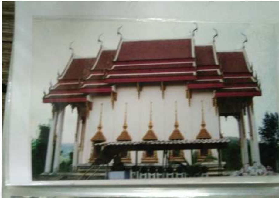
ภาพที่ 4.19 ผลงานภาพเขียนลายไทยตามโบสถ์ต่าง ๆ