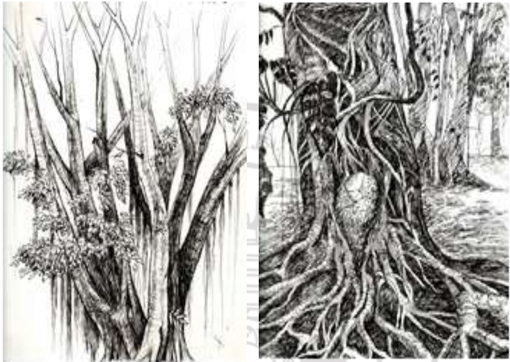
ภาพที่ 4.7 ผลงานทางด้านจิตรกรรม