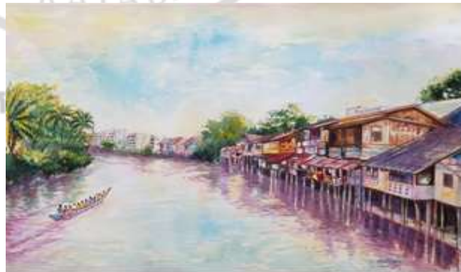
ภาพที่ 4.5 ภาพวาดริมน้ำจันทบูร