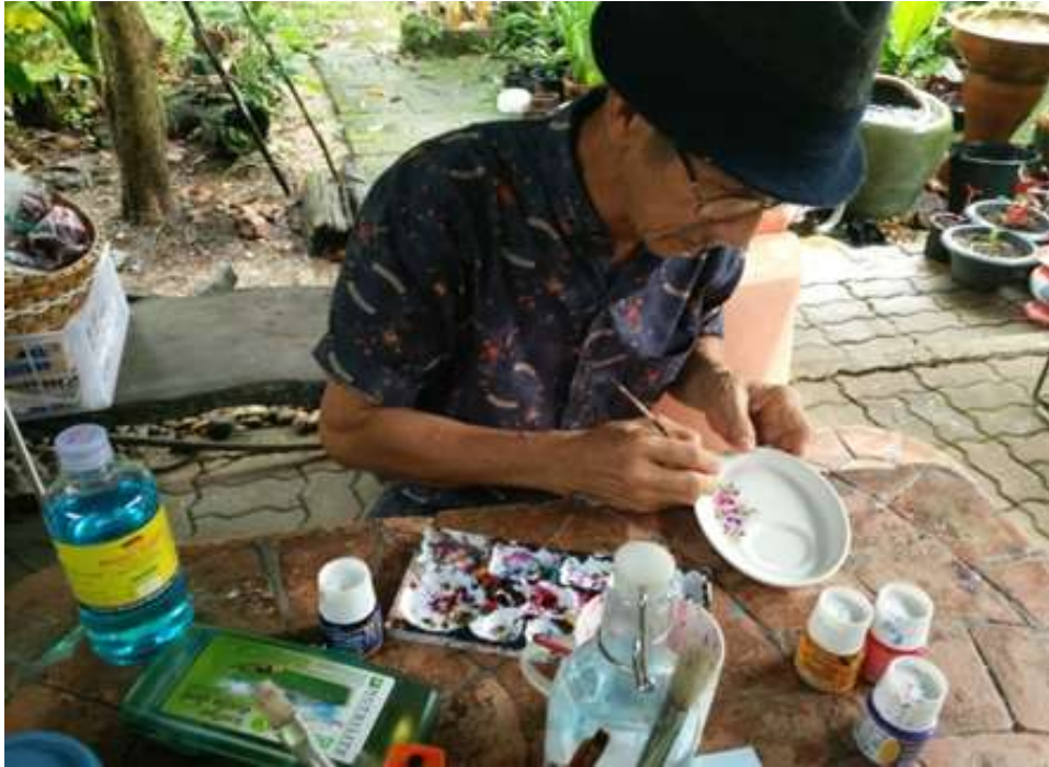
ภาพที่ 4.17 สาธิตการเพ้นท์บนกระเบื้องเซรามิค