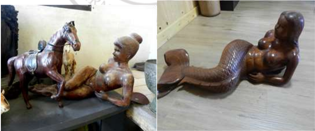
ภาพที่ 4.1 ผลงานด้านการแกะสลักไม้

โดยทั่วไปเมื่อกล่าวถึง “ศิลปะ” จะหมายถึง 2 ประเภทนี้คือ ประเภทแรกเป็นศิลปะ ประเภทที่เสถียรอยู่ได้นาน ไปเมื่อไหร่ก็เจอเมื่อนั้น เช่น ภาพพิมพ์ จิตรกรรม ประติมากรรม สถาปัตยกรรม ส่วนประเภทที่สอง เป็นศิลปะประเภทที่ไม่เสถียร เช่น ดนตรี นาฏศิลป์ แสดงเสร็จ ก็จะกลายเป็นความทรงจำ ยกเว้นจะมีการทำซ้ำ เช่น บันทึกเป็นรูปภาพ วิดีทัศน์ ประเด็นคือเราจะ มองงานด้านศิลปะว่าเป็นการทำวิจัยได้อย่างไร โดยภาพรวมของการทำงานศิลปะสักชิ้นก็คือ อันดับแรกเราต้องค้นคว้าก่อนว่าต้องใช้วัสดุอะไรบ้าง กระบวนการสร้างประกอบด้วยอะไร ต้องทำ อย่างไร ทำออกมาแล้วรูปร่างหน้าตาจะเป็นอย่างไร พอทำสำเร็จแล้วจะเกิดผลกระทบอะไรบ้าง จากงานศิลปะชิ้นนี้ ให้ความสุขจากการเสพหรือให้บทเรียนชีวิตด้วยหรือไม่ หรือทำให้แรงบันดาลใจ จากงานศิลปะชิ้นนี้ไปทำอะไรต่อหรือไม่ ดังนั้นผลงานของบุคคลที่ทำงานทางด้านศิลปวัฒนธรรม รวบรวมเป็นองค์ความรู้ อันจะเป็นประโยชน์ต่อการศึกษาค้นคว้าต่อไป ผลงานของอาจารย์ทองอยู่ ปิ่นภิบาล ดังภาพที่ 4.1- 4.4