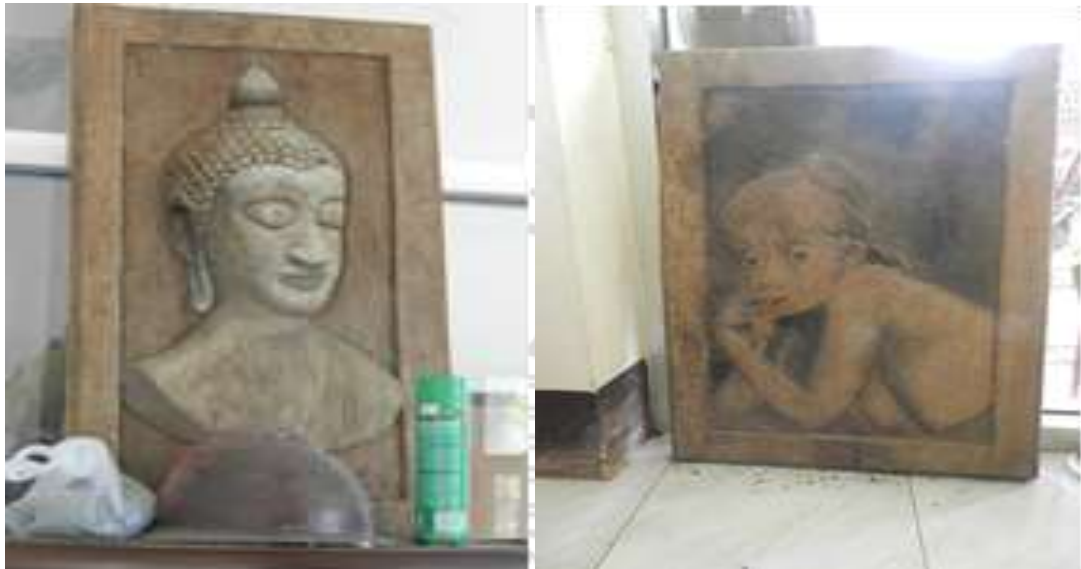
ภาพที่ 4.2 ผลงานที่โดดเด่นการแกะสลักไม้