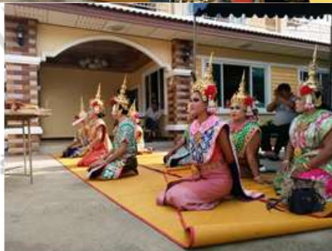
ภาพที่ 4.27 การแสดงละครชาตรีในสถานที่ต่าง ๆ