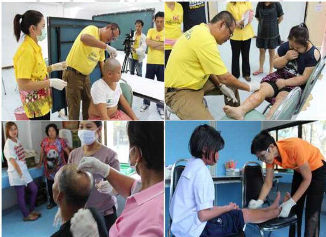
ภาพที่ 4.32 การให้การรักษาดูแลหนังศีรษะ และสะเก็ดเงินตามร่างกาย