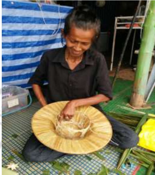
ภาพที่ 4.40 สาคิตการท่างอบขั้นตอนที่ 6

การทำหมวกงอบ 1 ใบ สามารถหล่อเลี้ยงอาชีพอื่น ๆ ได้อีก เช่น อาชีพคนตัดใบจาก อาชีพคนทำดอกจันท์ อาชีพคนผ่าต้นคุ่ม อาชีพคนเหลาไม้ไผ่ และอาชีพคนทำเสวียน อาชีพคนเหล่านี้จะทำสินค้าของตัวเองแล้วนำมาส่งให้คนสานหมวกงอบเป็นการพึ่งพาอาศัยกันด้านอาชีพ ถือว่าเป็นสิ่งที่สังคมมีความต้องการ