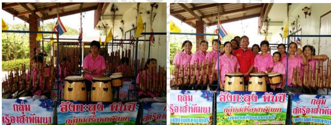
ภาพที่ 4.26 ภาพวง “อังกะลุงพันปี”

ในช่วงแรกของการจัดตั้งวง ก็เป็นการลองผิดลองถูก ให้คนที่เล่นเป็นสอนคนที่เล่นไม่เป็น บางครั้งก็เชิญอาจารย์ที่มีความรู้ด้านอังกะลุงมาช่วยสอนและแนะนำเทคนิควิธีการต่าง ๆ ส่วนมากสอนกันเอง เรียนรู้และฝึกซ้อมกันเอง จากที่เล่นที่ไม่ค่อยลงตัวสักเท่าไรในตอนแรก ๆ ก็สามารถเล่นได้พร้อมเพรียง เข้าจังหวะ ประกอบกับผู้นำกลุ่มก็ได้คิดหาเทคนิควิธีการที่จะเป็นการช่วยให้การเล่นอังกะลุงได้ง่ายขึ้น นั่นคือ การจดโน้ตดนตรี ที่อ่านแล้วเข้าใจง่าย รวมไปถึงการใช้เส้นหนังสือพิมพ์มัดอังกะลุงแทนเชือก ซึ่งจะช่วยให้เกิดแรงตึงกลับเวลาที่เขย่า ทำให้จังหวะของเพลงไม่หน่วง หรือยืดเกินไป นอกจากการเล่นเพลงแล้ว สมาชิกทุกคนยังต้องเรียนรู้เครื่องดนตรี การดูแลรักษา การตั้งเสียง การบรรเลงได้อย่างลงตัวกันต่อมา