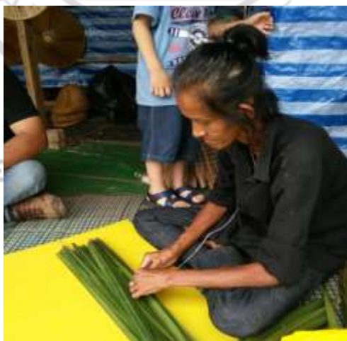
ภาพที่ 4.35 สาคิตการทำงานออบขั้นตอนที่ 1

1. ปั่นขึ้นรูป ใช้ใบจากเลือกขนาดความยาวเท่า ๆ กันความใหญ่พอ ๆ กันจำนวน 32 ใบ นำใบจากทั้งหมดมาเรียงซ้อนกัน วัดกึ่งกลางแล้วเจาะรูเย็บใบจากทั้งหมดให้ติดกันโดยเย็บริมวัดจากขอบใบประมาณ 3 มิลลิเมตร มัดให้ตั้งมือพอประมาณจากนั้นก็คลี่ใบจากเป็นวงกลมโดยจุดที่เย็บจะเป็นจุดกลางของงอบ ดังภาพที่ 4.35