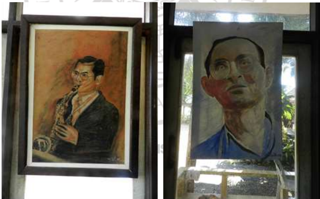
ภาพที่ 4.3 ผลงานที่เกี่ยวข้องกับพระมหากษัตริย์