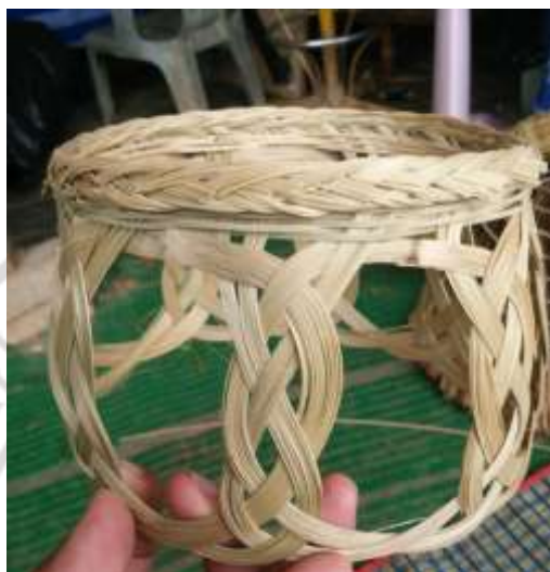
ภาพที่ 4.42 เสวียน สำหรับใช้เย็บติดด้านในสุดของหมวกงอบ

5. นายปราณีต เข็มดี อายุ 61 ปี อยู่บ้านเลขที่ 158 หมู่บ้านเนินดินแดง ตำบลเนินทราย อำเภอเมือง จังหวัดตราด จบการศึกษาชั้นประถมศึกษาปีที่ 6 จากโรงเรียนวัดเนินยาง เป็นคนบ้านเนินดินแดงแต่กำเนิด ได้อาศัยและเห็นวิถีชีวิตของคนในชุมชนมาตลอด ซึ่งในสมัยก่อนในเขตพื้นที่จังหวัดตราด ถือว่าเป็นพื้นที่ที่มีป่าอุดมสมบูรณ์มาก ต้นไม้ส่วนมากจะมีขนาดใหญ่ 2-3 คนโอบ หลังจากนั้นเมื่อชาวบ้านเข้าไปจับจองพื้นที่ เพื่อทำการเกษตร ต้นไม้ต่าง ๆ ก็ถูกตัด โคนทำลายหมด สุดท้ายก็เหลือแต่พื้นที่เปล่า ๆ ภูเขาเป็นภูเขาหัวโล้น ชาวบ้านเกิดความเดือดร้อน เนื่องจากปัญหาฝนไม่ตกต้องตามฤดูกาล หรือหากเป็นหน้าฝน ก็มักจะเกิดน้ำป่าไหลหลาก พัดเอาดินที่อยู่บนเขาทะลาลงมาพร้อมกับพืชผลการเกษตร เกิดความเสียหายอย่างแก่ปัญหาไม่ได้