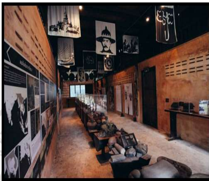
ภาพที่ 4.12 ภาพภายในหอประวัติศาสตร์ อ.ประสิทธิ์