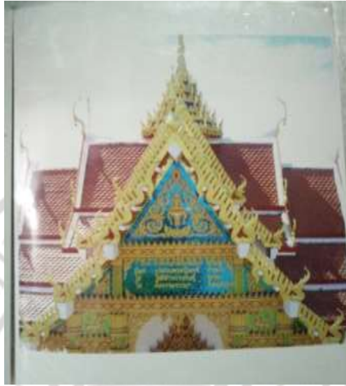
ภาพที่ 4.21 งานปูนปั้นที่โบสถ์วัดเนินดินแดงที่หอรพะวัง

ปัจจุบันลุงประโยชน์ ป่วยเป็นโรคกระดูกทับเส้นประสาท มือเท้าชา เดินไม่ได้มา 2 ปีแล้ว ต้องนอนอยู่ที่บ้าน มีภรรยาและลูกชายดูแล สุขภาพไม่ค่อยดี อีกไม่นานปราษฎ์ชาวบ้านแบบนี้ ก็จะหายไปหากไม่ได้มีการศึกษาเรียนรู้ และจดบันทึกไว้