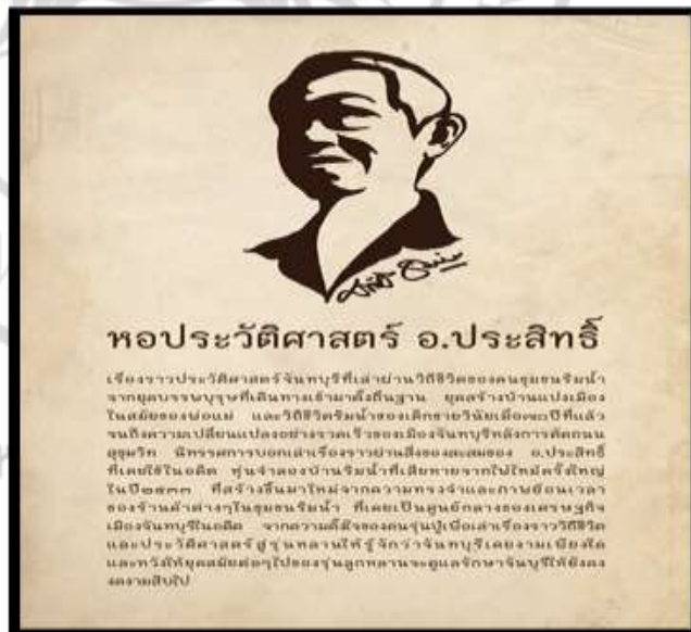
ภาพที่ 4.11 หอประวัติศาสตร์ อ.ประสิทธิ์