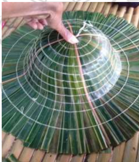
ภาพที่ 4.38 สาธิตการทำอบชิ้นตอนที่

4. เย็บใบจากแต่ละใบให้ติดกันตามรอยที่วงไว้ 12 วง ลักษณะการเย็บมี 2 แบบ แบบปกติจะเย็บจากวงในสุด ให้ครบรอบแล้วมาเริ่มวงที่ 2 ให้ครบรอบและเริ่มวงที่ 3 ไปเรื่อย ๆ อีกแบบจะเย็บแบบวงกันหอย คือ เริ่มจากวงในสุดแล้วต่อเป็นวงที่ 2,3 จนครบ ดังภาพที่ 4.38