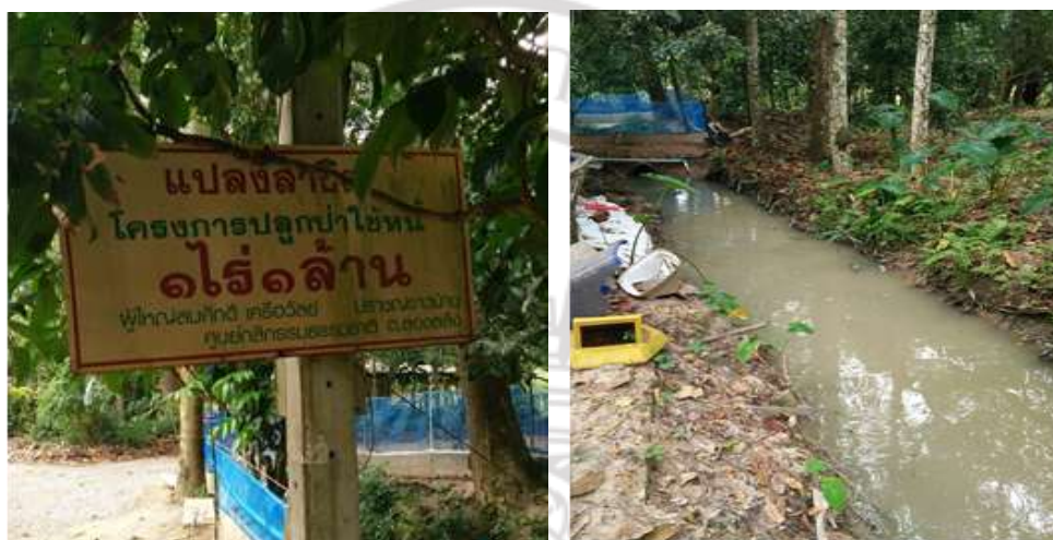
ภาพที่ 4.28 แปลงสาธิตโครงการปลูกป่าใช้หนี้ของผู้ใหญ่สมศักดิ์ เครือวัลย์

เพื่อกักบริเวณให้สุกรอยู่ แล้วใช้ขี้เลื่อยหรือ แกลบหรือ ฟาง ไล่ลงในคอกสุกร ราวด้วยจุนทรีย์ ย่อยสลาย ทำซ้ำ ๆ ไปเรื่อย ๆ พอสิ้นปีจะได้ปุ๋ยคอกที่ผ่านการผสม คลุกเคล้าระหว่างมูลสุกรกับ แกลบ หรือฟางหรือขี้เลื่อย ดังภาพที่ 4.28