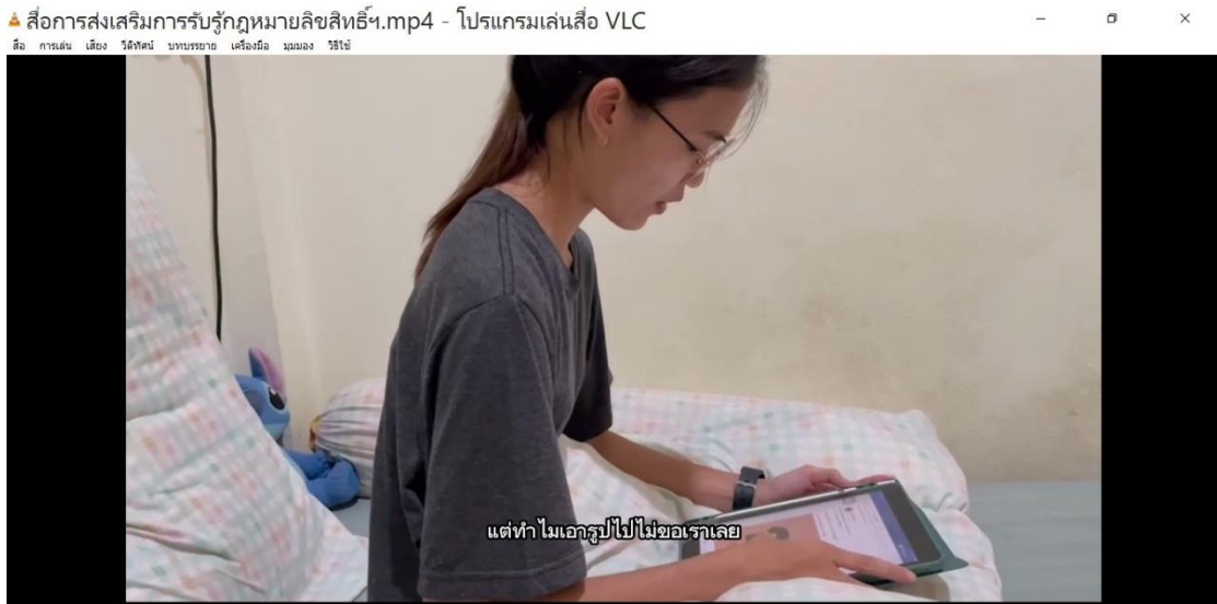
ภาพที่ 4.3 นักศึกษาพบเห็นงานของตนถูกนำไปใช้โดยมิได้ขออนุญาต

2.4 ขั้นตอนการทดลองใช้ (อยู่นอกเหนือขอบเขตการวิจัยจึงไม่มีการดำเนินการในส่วนนี้)