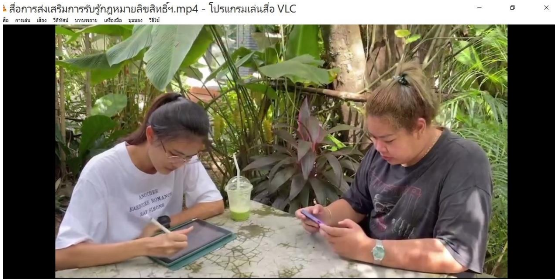
ภาพที่ 4.1 นักศึกษาวาดรูปอันเป็นการสร้างสรรค์งานอันลิขสิทธิ์