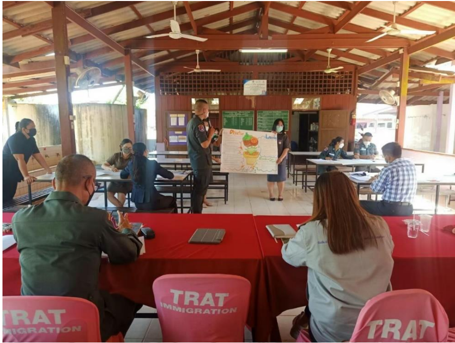
ภาพที่ 4.2 การประชุมเพื่อถอดบทเรียน