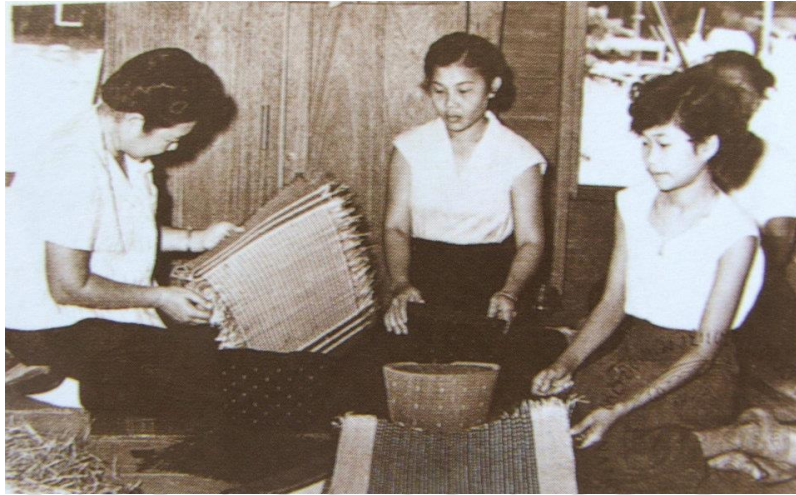
ภาพที่ 2.6 สมเด็จพระนางเจ้ารำไพพรรณีทรงตรวจสอบคุณภาพเสื่อด้วยพระองค์เอง