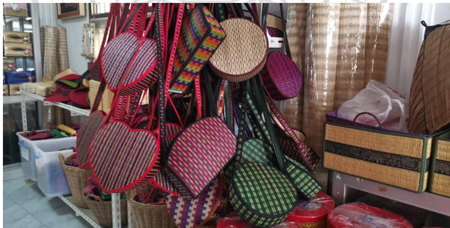
ภาพที่ 2.17 ผลิตภัณฑ์หรือสินค้าของวิสาหกิจชุมชนกลุ่มเสื่อบ้านท่าแฉลบ