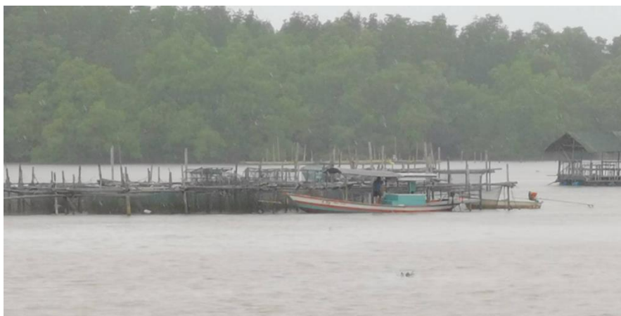
ภาพที่ 2.10 ลักษณะทางกายภาพของชุมชนท่าแฉลบ