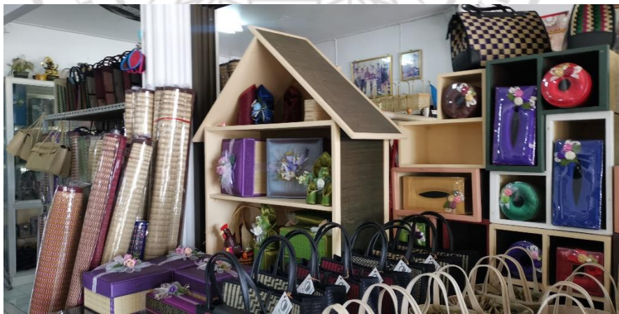
ภาพที่ 2.16 บรรยากาศของวิสาหกิจชุมชนกลุ่มเสื่อบ้านท่าแหลม