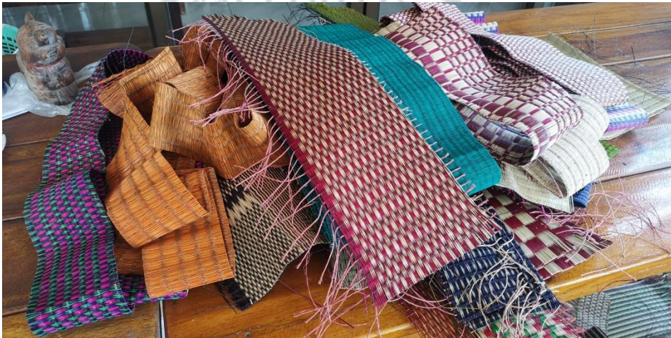
ภาพที่ 2.19 เศษเสื่อที่เหลือจากการแปรรูปเป็นผลิตภัณฑ์ต่าง ๆ แล้ว

เสื่อทาทาแอลบ เสื่อกกจันทบุรีแท้ ๆ จากวิถีชีวิตสู่การพัฒนาเสื่อให้เกิดประโยชน์สูงสุด มีความร่วมสมัย มีคุณค่า มีความพิถีพิถันในทุกรายละเอียด การันตีจากรางวัลคุณภาพชั้นเยี่ยม จนได้รับตรา GI ถือเป็นอีกหนึ่งสถานที่ที่มีการดูงานจากหน่วยงานต่าง ๆ ทั้งในจังหวัดและต่างจังหวัด