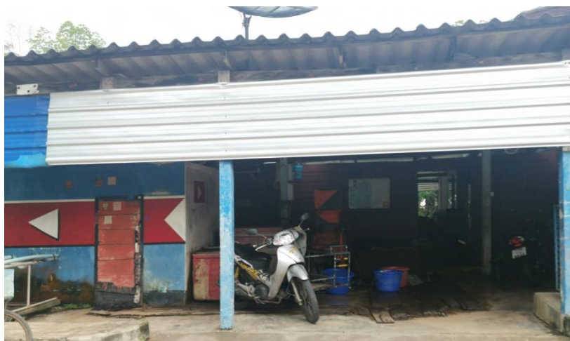
ภาพที่ 2.12 ลักษณะทางกายภาพของชุมชนท่าแฉลบ