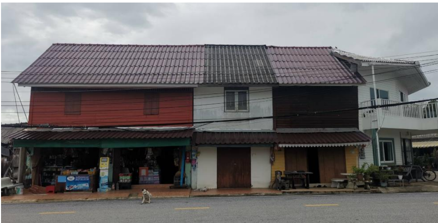
ภาพที่ 2.13 ลักษณะทางกายภาพของชุมชนท่าแฉลบ