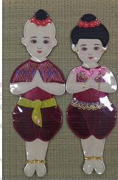
ภาพที่ 2.18 ภาพปะติดจากเสื่อกก เด็กผมจุกสวัสดิ์ หญิง-ชาย

การทอเสื่อของกลุ่มวิสาหกิจชุมชนกลุ่มเสื่อบ้านท่าแฉลบในครั้งแรกเกิดจากการรวมตัวกันของสมาชิกที่ประกอบอาชีพทอเสื่อ แปรรูปผลิตภัณฑ์จากเสื่อเหมือนกัน หรือที่มีเวลาว่างที่ตรงกัน และเป็นผู้ที่ได้รับการถ่ายทอดความรู้เรื่องเสื่อกก มีทักษะเรื่องการปลูกกก การเตรียมกกและการทอเสื่อกก เกิดการรวมกลุ่มกันเพื่อที่จะเพิ่มรายได้ให้กับตนเองและครอบครัวให้สูงขึ้นด้วยมีความต้องการที่จะให้เป็นการสืบทอดอาชีพและรักษามรดกภูมิปัญญาท้องถิ่นของหมู่บ้านไว้ เมื่อเกิดการรวมตัวกันเป็นวิสาหกิจชุมชนแล้ว จึงมีการแปรรูปเสื่อให้เป็นผลิตภัณฑ์อื่น ๆ เพื่อเพิ่มมูลค่าให้กับสินค้า ทางกลุ่มได้มีการคิดและพัฒนาผลิตภัณฑ์ตลอดเวลา เพื่อที่จะให้สินค้าตรงกับความต้องการของลูกค้า ซึ่งบางครั้งนั้นลูกค้าก็จะเป็นผู้เสนอรูปแบบสินค้าที่ทันต้องการให้ทางกลุ่มผลิตให้ ทำให้ผลิตภัณฑ์มีรูปแบบที่ทันสมัยและตรงกับความต้องการของลูกค้า ทำให้สามารถจำหน่ายได้รวดเร็วขึ้น ผลิตภัณฑ์ใหม่ ๆ ที่ทางกลุ่มคิดค้น เช่น ตะกร้าลายต้นสน และเสื่อตะไคร้หอม เป็นต้น