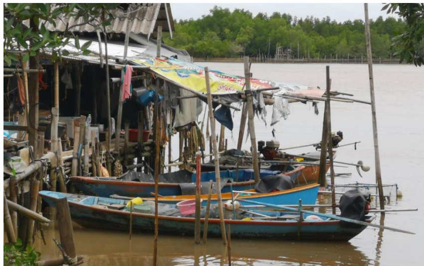
ภาพที่ 2.11 ลักษณะทางกายภาพของชุมชนท่าแฉลบ