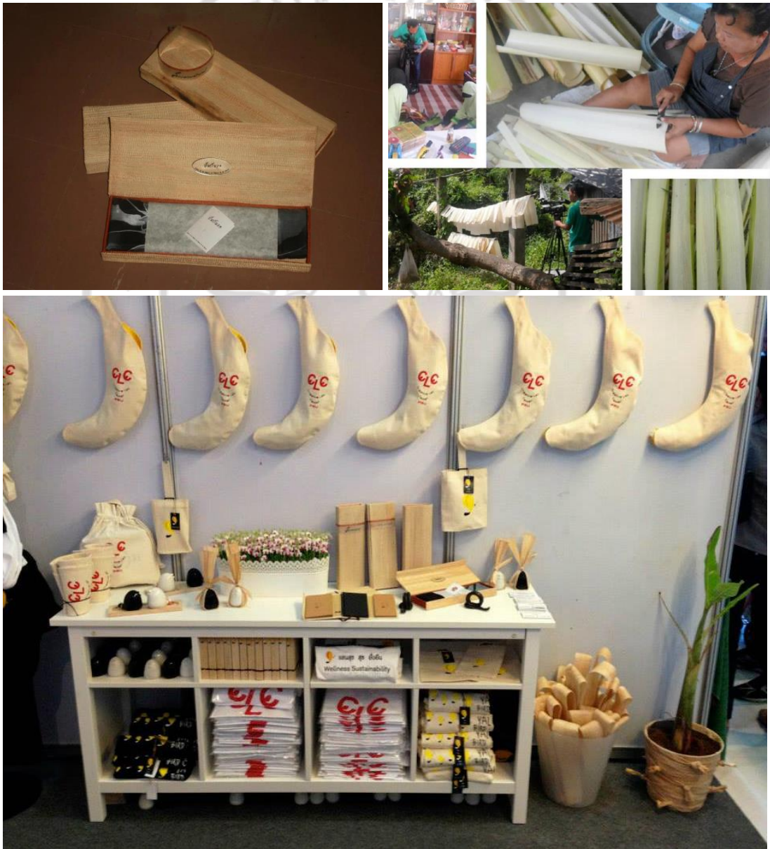
ภาพที่ 2.3 หัตถกรรมจากกาบกล้วยของชุมชนกาบกล้วย กรือเซะ บาราโหม จ.ปัตตานี

ปีนกันแล หัตถกรรมจากกาบกล้วยของชุมชนกาบกล้วย กรือเซะ บาราโหม จ.ปัตตานี กาบกล้วยเป็นวัตถุดิบที่หาง่ายในท้องถิ่น เมื่อบวกทักษะฝีมือด้านหัตถกรรมที่ชุมชนนี้มีอยู่แล้ว ซึ่งเป็นต้นทุนสำคัญในการผลิตทำให้เกิดงานหัตถกรรม แต่เมื่อได้รับองค์ความรู้จากวิทยาลัย สงขลาครินทร์ช่วยเหลือในด้านการพัฒนาผลิตภัณฑ์ เช่น แก้ปัญหาความชื้น และเชื้อรา จากกาบกล้วยทำให้สินค้าคงทน ทำให้สินค้าจากราคาหลักกล้วยกลายเป็นหลักพัน ชุมชนจึงมีกำลังใจ ในการผลิตงานออกมาอย่างต่อเนื่องและมีรายได้ที่มั่นคง