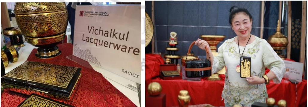
ภาพที่ 2.4 ผลิตภัณฑ์ที่ปรับให้เข้ากับการใช้ชีวิตของคนสมัยใหม่