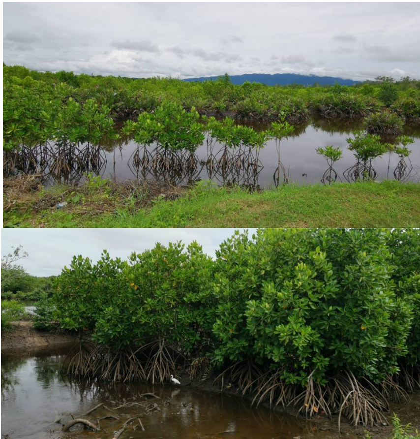
ภาพที่ 2.14 ลักษณะทางกายภาพของชุมชนท่าแฉลบ