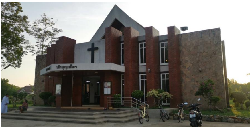
ภาพที่ 2.15 ลักษณะทางกายภาพของชุมชนท่าแฉลบ