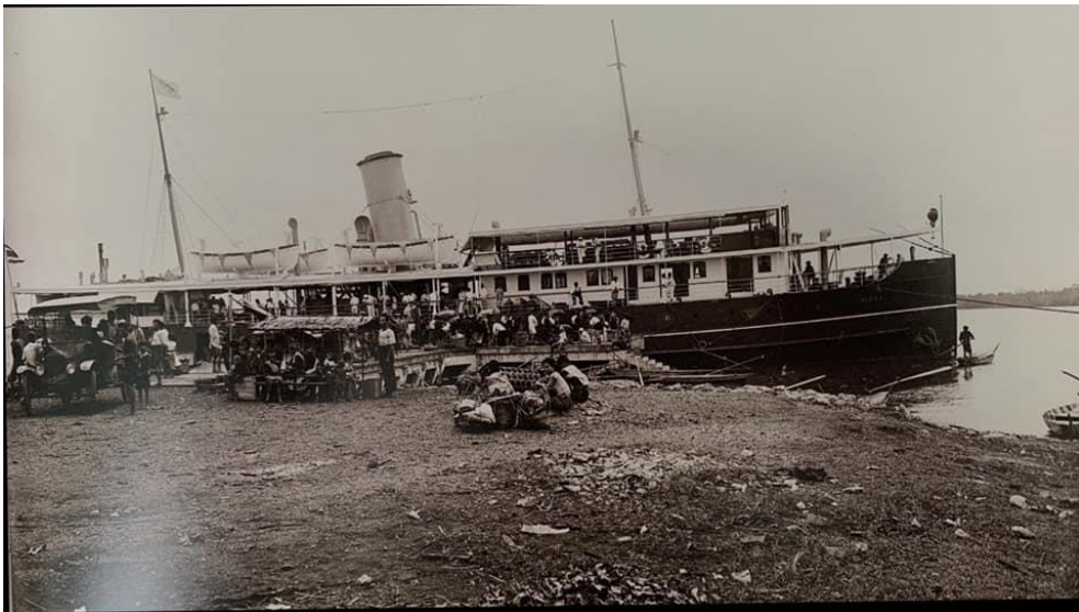
ภาพที่ 2.9 เรือเมล์เทียบท่าแฉลบ