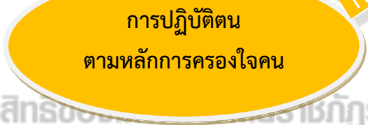
ภาพที่ 4.2 แผนภาพสรุปการปฏิบัติตนตามหลักการครองใจคน