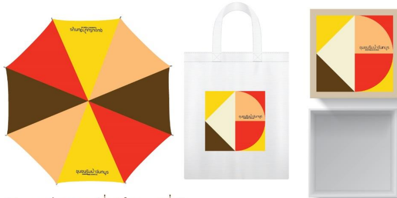
แบบร่างของที่ระลึกแบบที่ 2 แนวคิดในการออกแบบ : เป็นการนำเอาโทนสีที่มีความเกี่ยวข้องกับชุมชนริมน้ำเพื่อนำมาออกแบบของที่ระลึก ได้แก่ สีเหลือง เป็นสีประจำจังหวัดจันทบุรี สีแดง แสดงถึงความเกี่ยวพันของชุมชนชาวจีนที่อาศัยอยู่ในชุมชนริมน้ำ และสีน้ำตาล แสดงถึง ความเป็นพื้นถิ่น