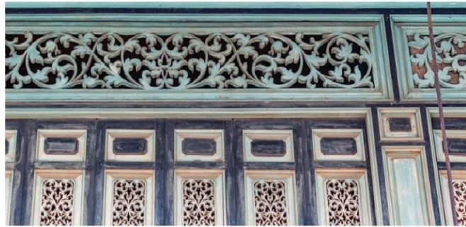
ภาพที่ 4.1 แบบร่างลวดลายกราฟิก ช่องลมไม้ฉลุลายขนมปังขิง