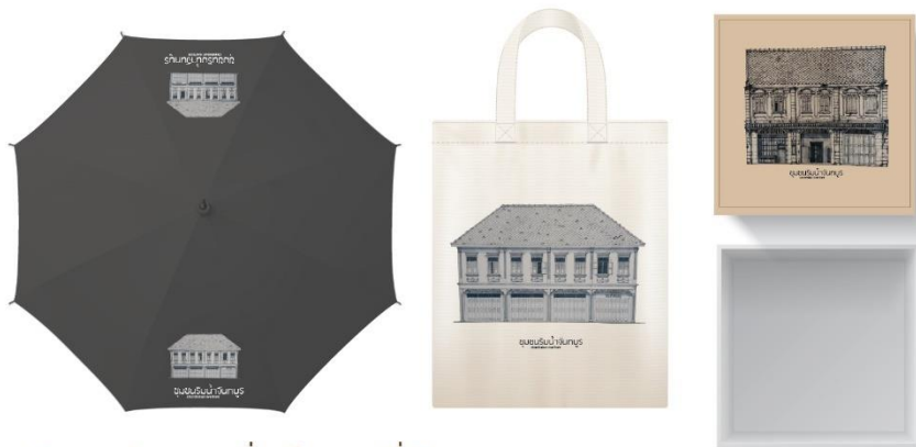
แบบร่างของที่ระลึกแบบที่ 3 ออกแบบในโทนสีดำและใช้สถาปัตยกรรมที่โดดเด่นในชุมชนริมน้ำมาจัดวาง เพื่อแสดงถึงความเรียบง่าย สงบ