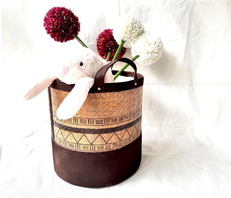
ภาพที่ 4.25 ต้นแบบตะกร้าจากคลุ้มที่ใช้เทคนิคการจี้ร้อน