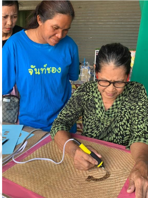
ภาพกิจกรรมถอดบทเรียนเรื่องการตกแต่งพื้นผิวคลุ้มด้วยเทคนิคการเผา