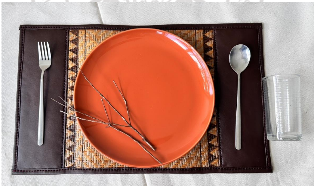
ภาพที่ 4.26 ต้นแบบแผ่นรองจานและช้อนส้อมจากคลุ้มที่ใช้เทคนิคการจี้ร้อน