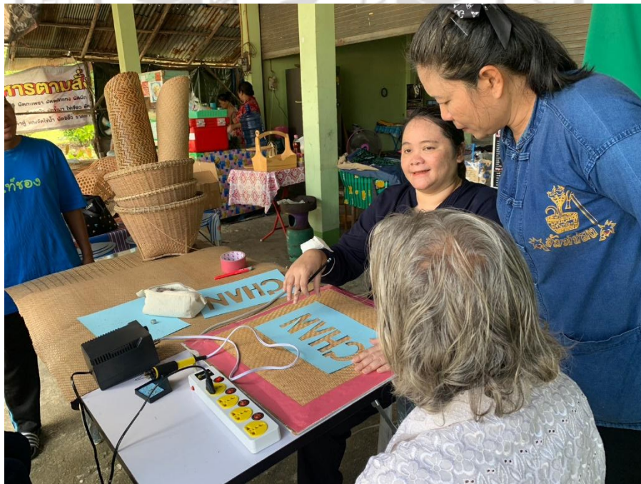
ภาพกิจกรรมถอดบทเรียนเรื่องการตกแต่งพื้นผิวคลุ้มด้วยเทคนิคการเผา