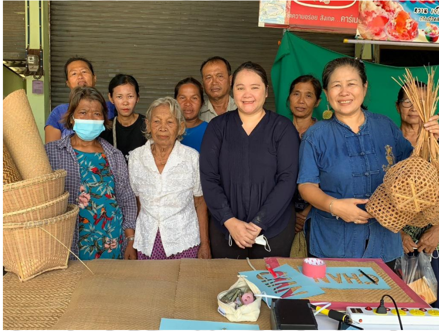
ภาพกิจกรรมถอดบทเรียนเรื่องการตกแต่งพื้นผิวคลุ้มด้วยเทคนิคการเผา