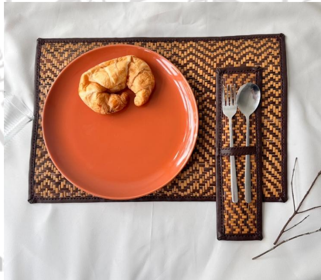
ภาพที่ 4.28 ต้นแบบแผ่นรองจานและช้อนส้อมจากคลุ้มที่ใช้เทคนิคการเผาแบบชาสุกิบัน