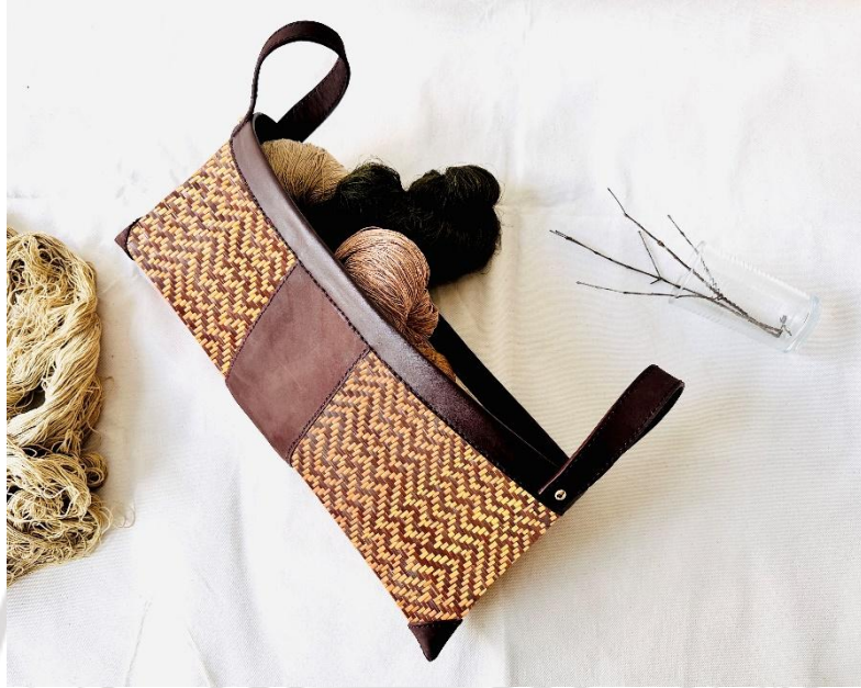
ภาพที่ 4.27 ต้นแบบตะกร้าจากคลุ้มที่ใช้เทคนิคการเผาแบบชาสุกิบัน