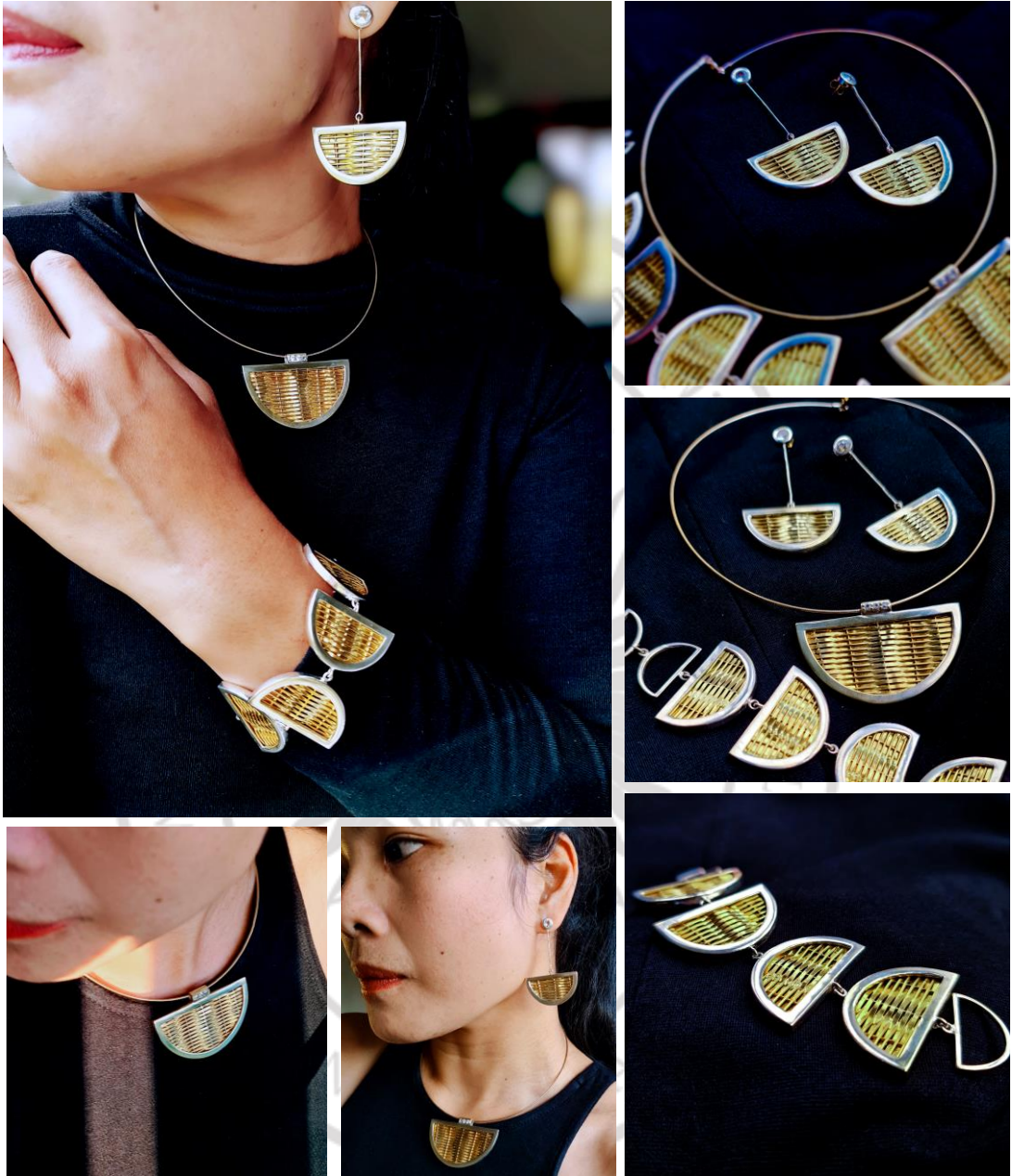
ลิขสิทธิ์ของมหาวิทยาลัยราชภัฏรำไพพรรณี