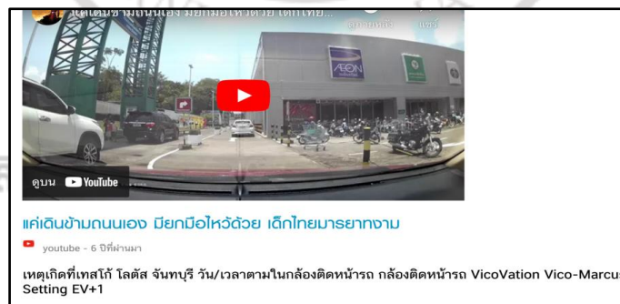
ภาพที่ 4.3 ตัวอย่างวีดิทัศน์ประกอบการนำเสนอข่าวของเว็บ Kapook

สำหรับคลิปดังกล่าวนั้น ถ่ายจากกล้องหน้ารถที่กำลังเข้าลานจอดรถของห้างเทสโก้ โลตัส จันทบุรี ก่อนที่จะมีเด็กคนหนึ่ง ยกมือไหว้มาทางรถคันหนึ่ง เพื่อขอข้ามถนน เรียกเสียงชื่นชมเป็นจำนวนมาก (Kapook, 24 พฤศจิกายน 2559)