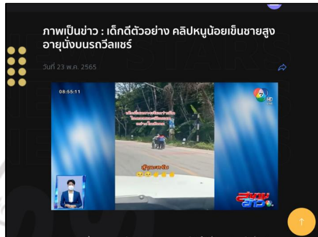
ภาพที่ 4.2 ตัวอย่างวีดิทัศน์ประกอบการนำเสนอข่าวของเว็บ Ch7