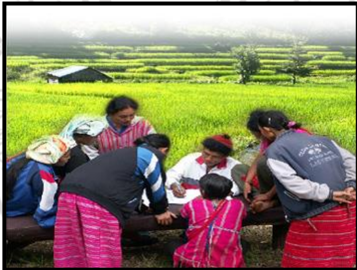
ภาพที่ 2.2 การมีส่วนร่วมของชุมชน

โดยผู้เขียนได้ทำการอธิบายเนื้อหาในแต่ละหลักการของการท่องเที่ยวโดยชุมชนเพิ่มเติม เพื่อให้มีความเข้าใจในเนื้อหาเพิ่มขึ้น ดังรายละเอียดต่อไปนี้