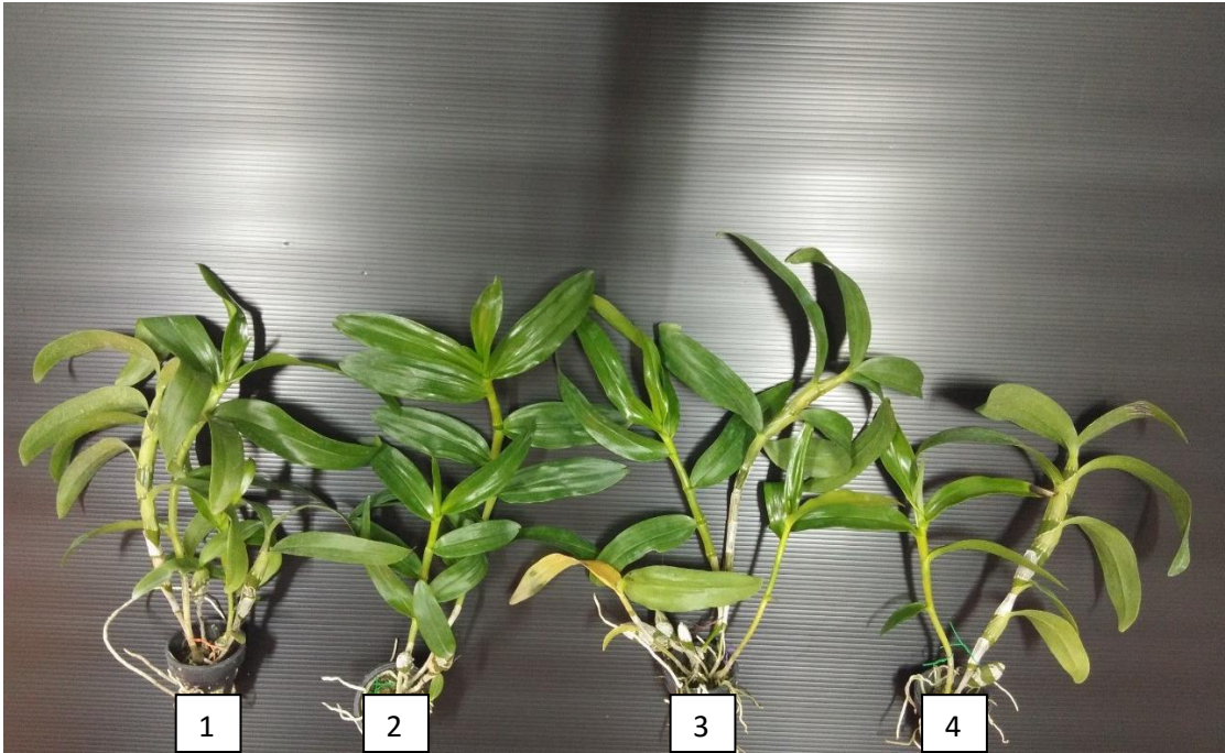
ภาพภาคผนวกที่ 1 กล้วยไม้เหลืองจันทบูรก่อนนำไปเลี้ยงภายใต้แสงสีต่าง ๆ