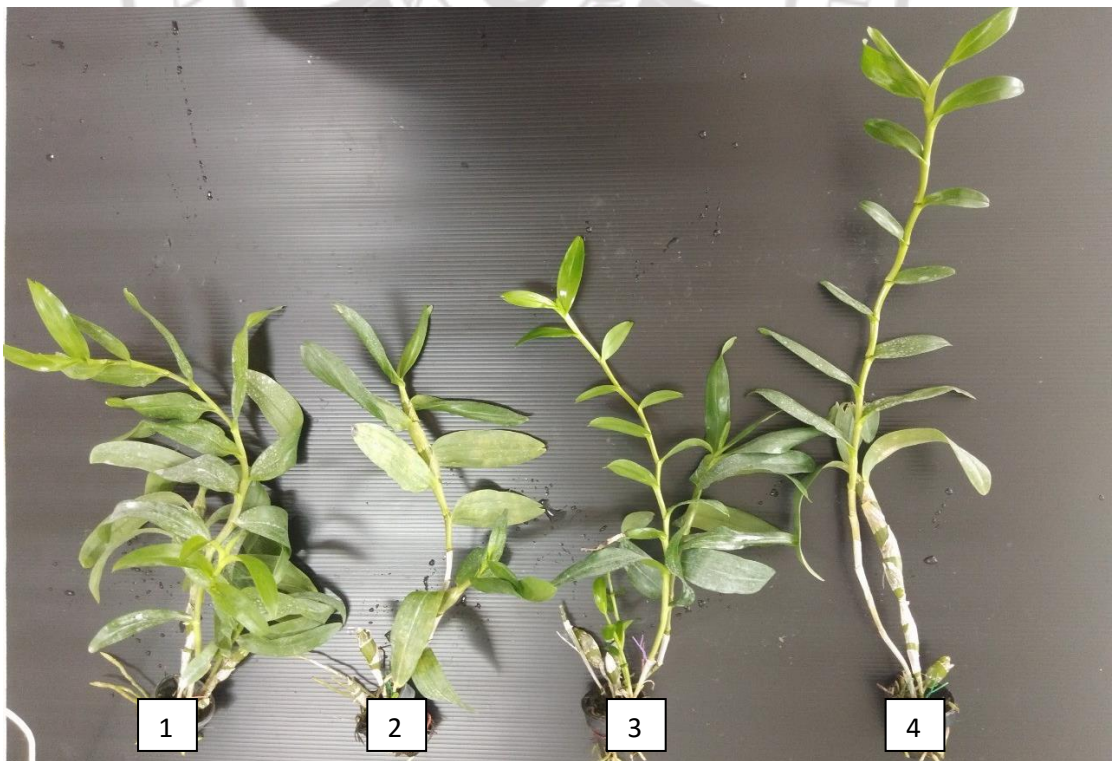
ภาพภาคผนวกที่ 6 กล้วยไม้เหลืองจันทบูรก่อนนำไปเลี้ยงภายใต้แสงสีต่าง ๆ นาน 5 เดือน