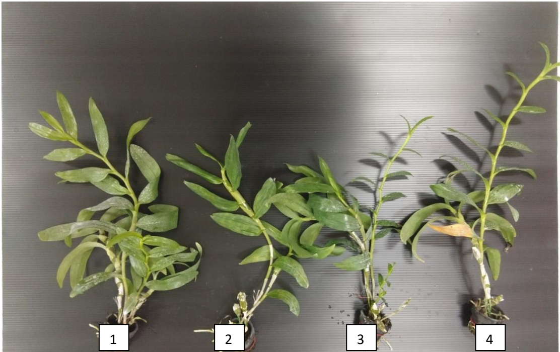
ภาพภาคผนวกที่ 5 กล้วยไม้เหลืองจันทบูรก่อนนำไปเลี้ยงภายใต้แสงสีต่าง ๆ นาน 4 เดือน