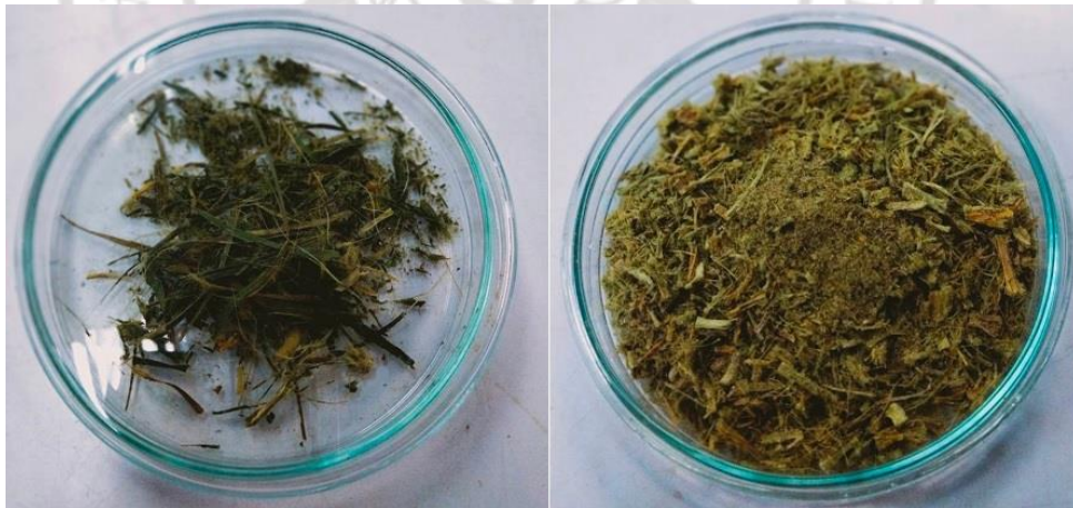
ภาพภาคผนวกที่ 10 ลักษณะลำต้นของกล้วยไม้เหลืองจันทร์บุรุษที่ผ่านการอบแห้งและบด