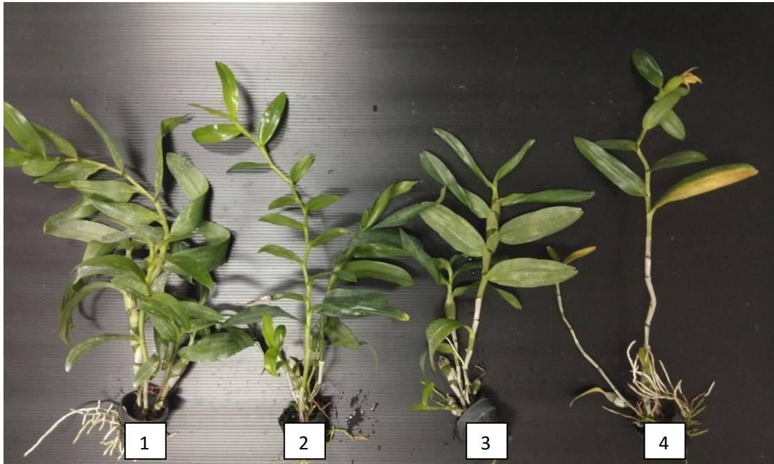
ภาพภาคผนวกที่ 7 กล้วยไม้เหลืองเงินทบูรก่อนนำไปเลี้ยงภายใต้แสงสีต่าง ๆ นาน 6 เดือน