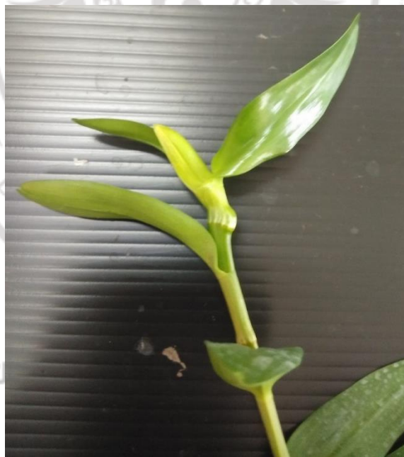
ภาพภาคผนวกที่ 8 กล้วยไม้เหลืองเงินทบูรออกดอกภายหลังการเลี้ยงภายใต้แสงจากหลอด LED อัตราส่วน Red 77 ดวง : Blue 44 ดวง : Orange 77 ดวง : White 24 ดวง นาน 5 เดือน