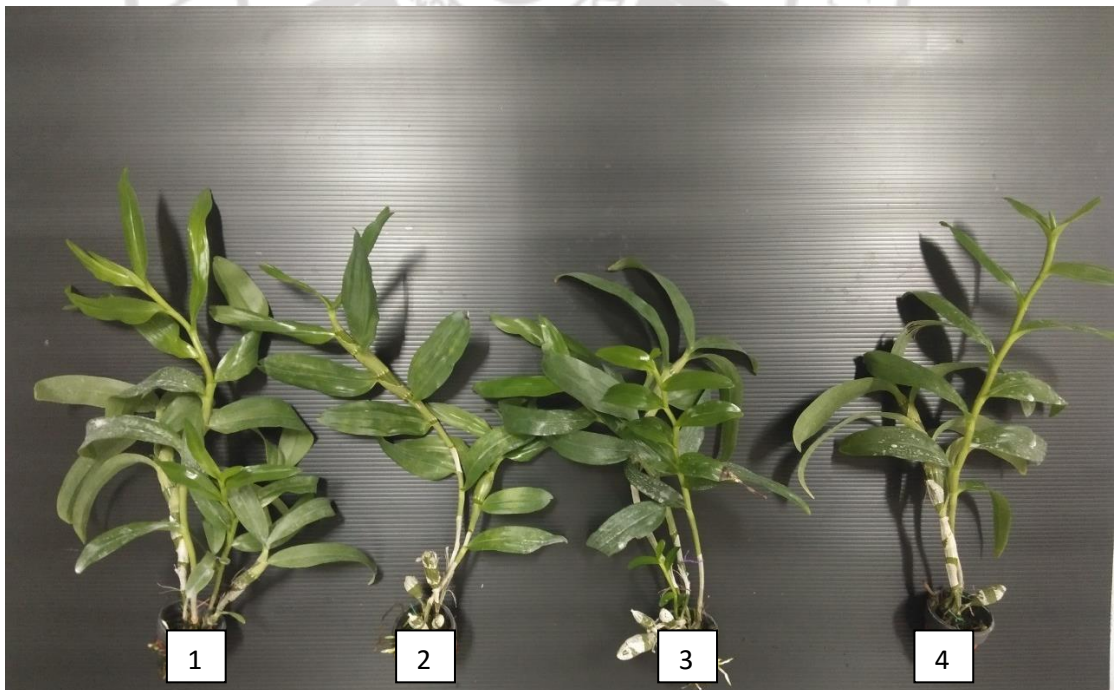
ภาพภาคผนวกที่ 4 กล้วยไม้เหลืองเงินทบูรก่อนนำไปเลี้ยงภายใต้แสงสีต่าง ๆ นาน 3 เดือน