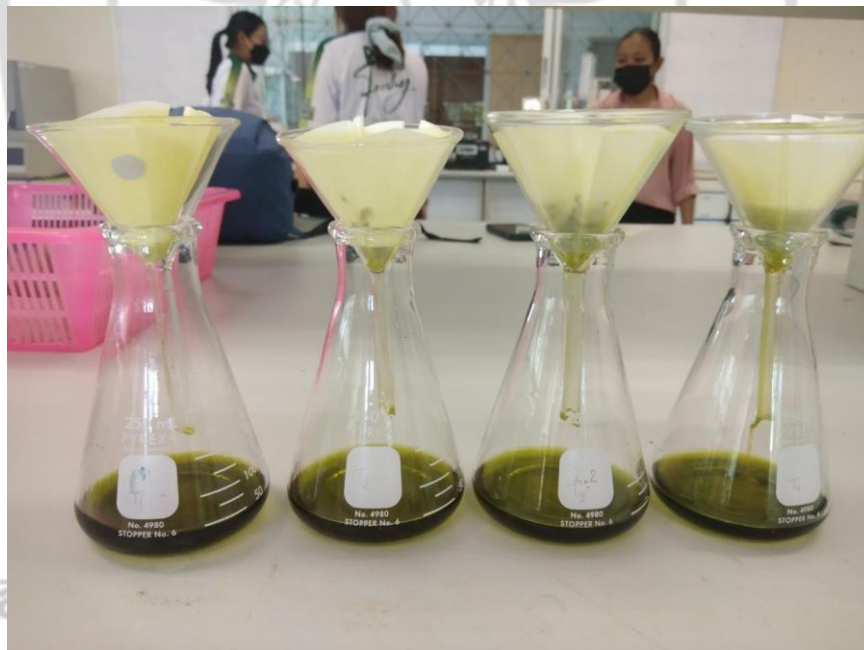
ภาพภาคผนวกที่ 12 นำสารสกัดจากกล้วยไม้เหลืองจินทบูรมากรอง หลังสกัดด้วยวิธีอัลตราโซนิก