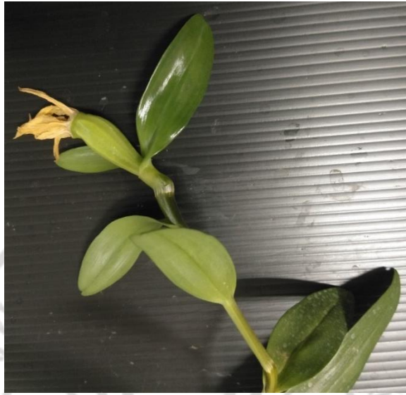
ภาพภาคผนวกที่ 9 ฝักกล้วยไม้เหลืองจันทร์บุรุษหลังการเลี้ยงภายใต้แสงจากหลอด LED อัตราส่วน Red 77 ดวง : Blue 44 ดวง : Orange 77 ดวง : White 24 ดวง นาน 24 สัปดาห์