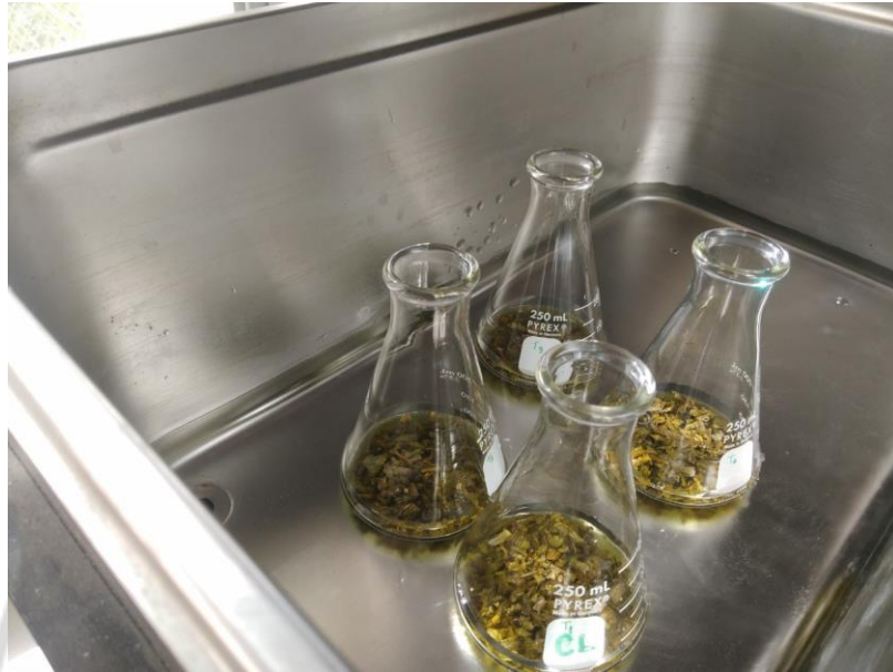
ภาพภาคผนวกที่ 11 การสกัดสารจากกล้วยไม้เหลืองจินทบูรด้วยวิธีอัลตราโซนิก