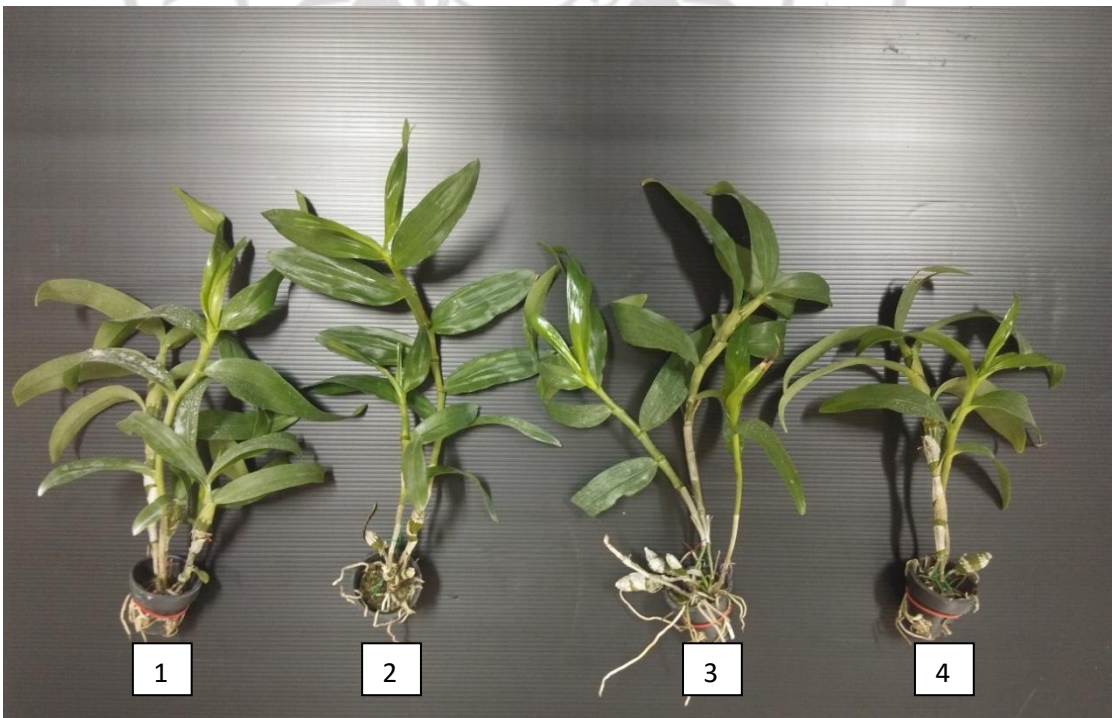
ภาพภาคผนวกที่ 2 กล้วยไม้เหลืองจันทบูรก่อนนำไปเลี้ยงภายใต้แสงสีต่าง ๆ นาน 1 เดือน